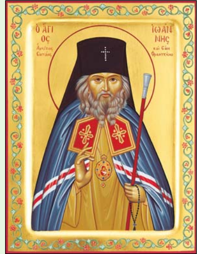
Ἐκ τοῦ Ἁγιογραφείου τῆς Ἱερᾶς Μονῆς μας (2004).