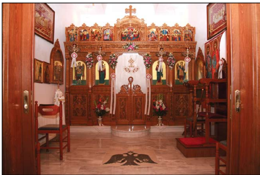
Ἰ. Ἡσυχαστήριον Μεταμορφώσεως τοῦ Σωτῆρος, εἰς Συνάμινον Ὠρωποῦ Ἀττικῆς.