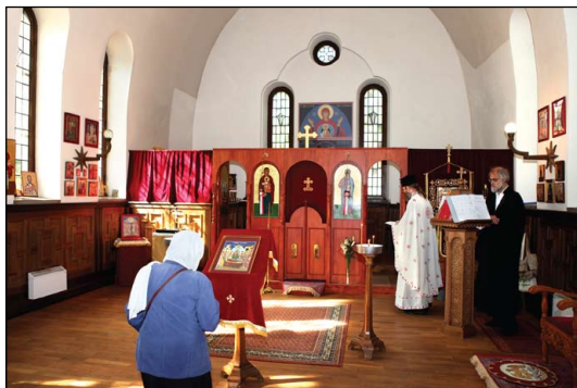
Ἱερὸς Ναὸς Κοιμήσεως τῆς Θεοτόκου Οὐψάλης.