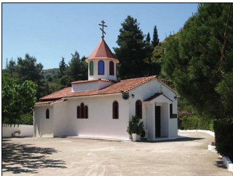
Ἐρὸς Ναὸς Ἀναλήψεως Ἀνθουπόλεως Πατρῶν.