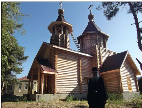
Ἱερὸς Ναὸς Κοιμήσεως τῆς Θεοτόκου εἰς Ζναούρι Νοτίου Ὀσσετίας.