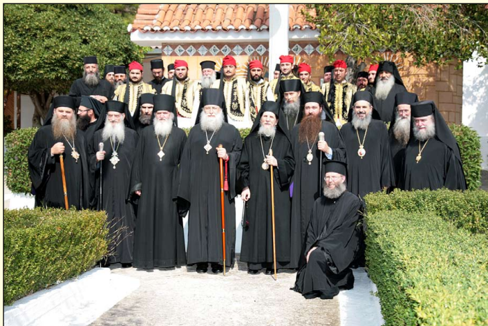
Ἀπὸ τὴν Πανήγυριν τῆς Ἱερᾶς Μονῆς τῶν Ἁγίων Κυπριανοῦ καὶ Ἰουστίνης Φυλῆς Ἀττικῆς, 2.10.2012 ἐκ.ἡμ.