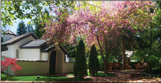
Ἱερὰ Ἀνδρῶα Μονὴ Ἁγίου Γρηγορίου Παλαμᾶ εἰς Ἔτνα Καλιφορνίας τῶν Η.Π.Α.