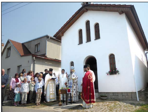
Ἱ. Ναὸς Ἁγίου Ἰωάννου Μαξίμοβιτς εἰς Γιεζντοβίτσε Τσεχίας.