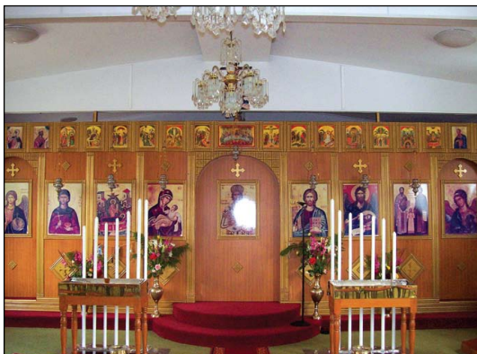
Ί. Ναὸς Κοιμήσεως τῆς Θεοτόκου εἰς Μελβούρνην Αὐστραλίας.