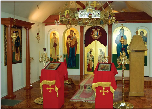
Ἱερὸς Ναὸς Ἁγίων Κυπριανοῦ καὶ Ἰουστίνης, εἰς Ἔτνα Καλιφορνίας τῶν Η.Π.Α.