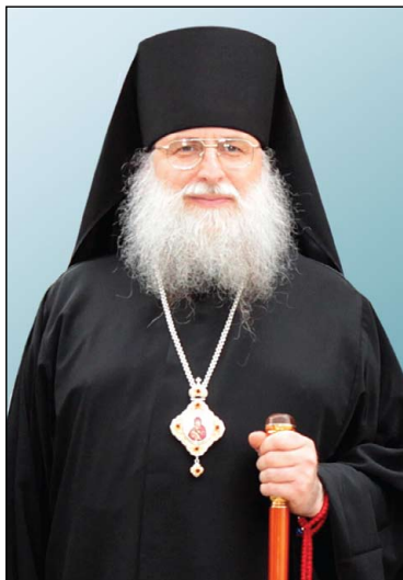
Ὁ Σεβασμ. Ἐπίσκοπος Τριάδισα κ. Φώτιος