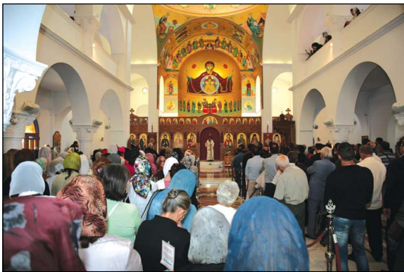
Ἐσωτερικὴ ἄποψις τοῦ Προσκυνηματικοῦ Ναοῦ τῆς Ἱερᾶς Μονῆς τῶν Ἁγίων Κυριανοῦ καὶ Ἰουστίνης Φυλῆς.