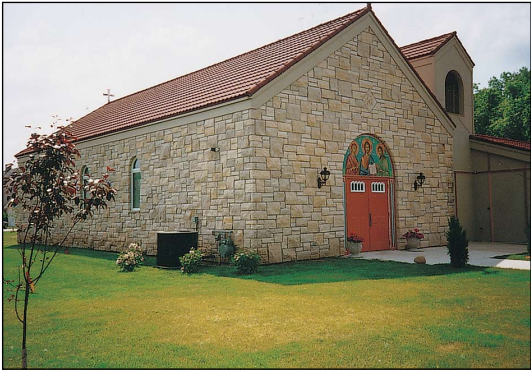
Ἱερὸς Ναὸς Τιμίου Προδρόμου, εἰς Ἀϊόβα τῶν Η.Π.Α.