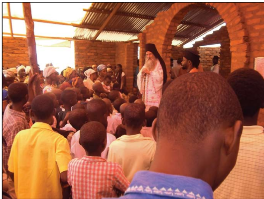
Ἱεραποστολικὴ Κοινότης εἰς Κονγκό.