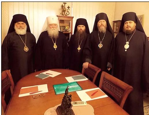
Ἡ Μόνιμος Ἀρχιερατικὴ Ἱερὰ Σύνοδος τῆς Ρωσικῆς Ὁρθοδόξου Ἐκκλησίας ἐν Διασπορᾷ.

Ἡ ΡΟΕΔ ἀριθμεῖ περὶ τὰς ἐνενήκοντα (90) Ἐνορίας, μὲ ἰσαριθμούς Κληρικούς, εἰς Οὐκράνιαν, Β. καὶ Ν. Ἀμερικὴν, εἰς περιοχὰς τῆς πρώην Σοβιετικῆς Ἐνώσεως καὶ εἰς τινὰ ἄλλα μέρη τοῦ κόσμου.