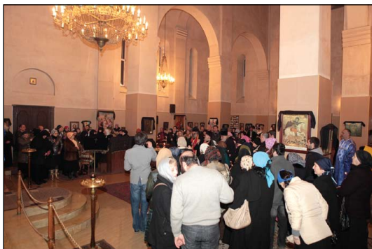
Ἱερός Ναός Παναγίας Πορταϊτίσσης Τιφλίδος.