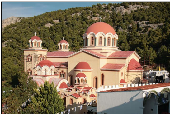
Ἱερὰ Μονὴ Ἁγίων Κυριανοῦ καὶ Ἰουστίνης Φυλῆς Ἀττικῆς.