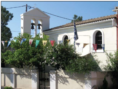
Ἱερὸς Ναὸς Ἀγίου Ἰσαύρου Γαρίτσας Κερκύρας.