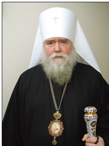
Ὁ Σεβ. Μητροπολίτης κ. Ἀγαθάγγελος, Πρωθιεράρχης τῆς Ρ.Ο.Ε.Δ.