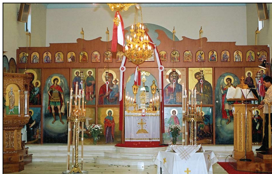
Ίερός Ναός Ἀγίων Ἀναργύρων εἰς Σύδνεϋ Ἀυστραλίας.