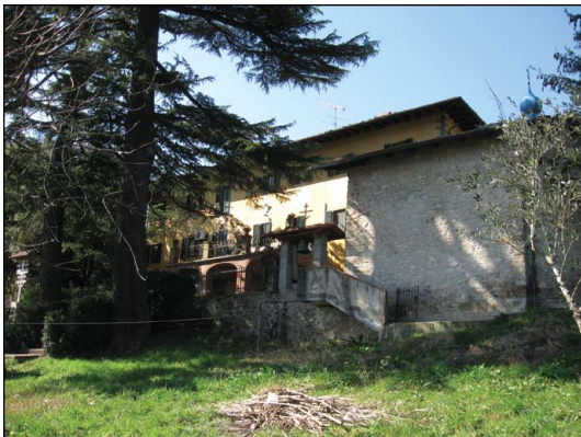
Ἱερὰ Μονὴ Ὁσίου Σεραφεῖμ τοῦ Σάρωφ Πιστόϊα Ἰταλίας.