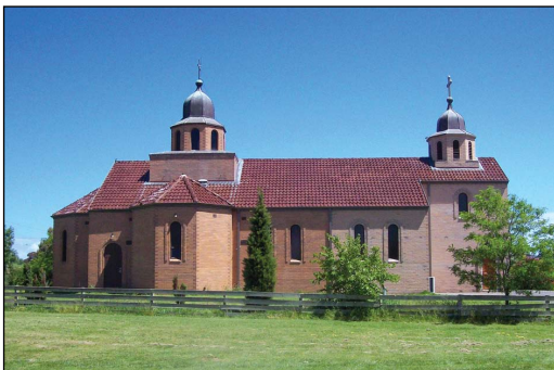
Ί. Ναὸς Ἁγίου Στεφάνου Ντέτσανι εἰς Μελβούρνην Αὐστραλίας.