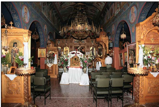
Ἱερὰ Μονὴ Παναγίας Μυρτιδιωτίσσης Σταμάτας Ἀττικῆς.