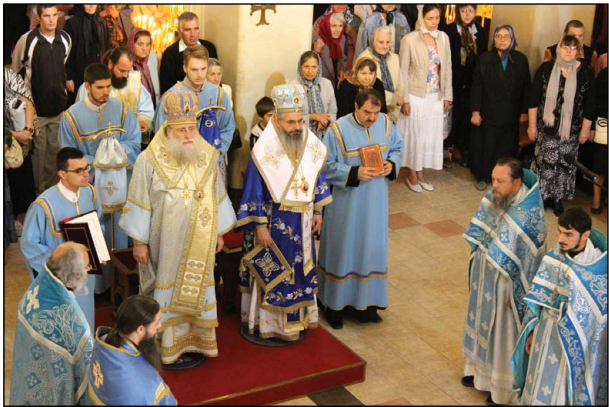
Ἀπὸ τὴν Πανήγυριν τῆς Κοιμήσεως τῆς Θεοτόκου εἰς Σόφιαν Βουλγαρίας, 15.8.2012 ἐκ.ἡμ.