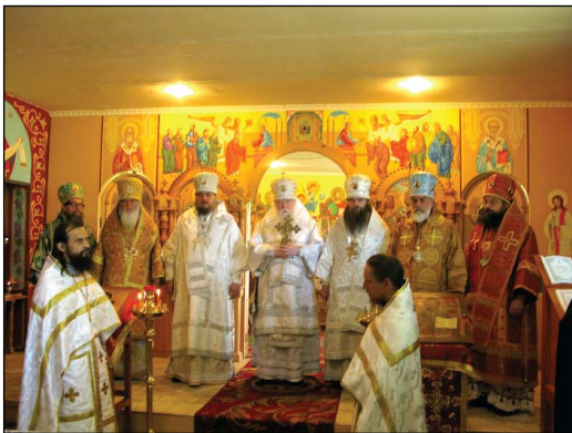
Ἀρχιερεῖς καὶ Κληρικοὶ τῆς Ρωσικῆς Ὀρθοδόξου Ἐκκλησίας ἐν Διασπορᾷ ὑπὸ τὸν Σεβασμ. Μητροπολίτην κ. Ἀγαθάγγελον.