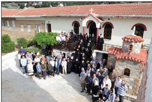
Κληρικολαϊκὴ Συναξὶς Ἱερᾶς Μητροπόλεως Ὠρωποῦ καὶ Φυλῆς εἰς Ἱερὰν Μονὴν Ἁγίας Παρασκευῆς Ἀχαρνῶν Ἀττικῆς, Ἀπρίλιος 2012.