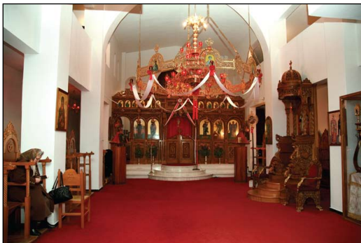
Ἱερὸς Ναὸς Ἁγίας Ξένης τῆς Ρωσίδος, εἰς Νέα Παλάτια Ὠρωποῦ Ἀττικῆς.