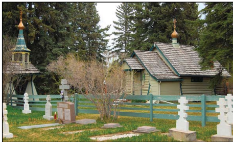
Ἱερὰ Γυναικεῖα Μονὴ Ἁγίας Σκέπης τῆς Θεοτόκου, εἰς Μπλάφτον Ἀλμπέρτας τοῦ Καναδά.