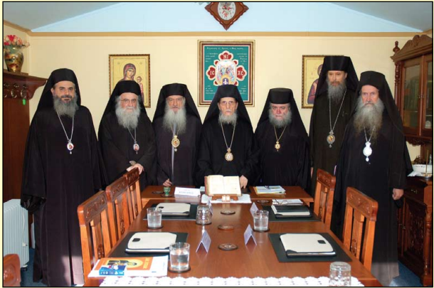
Συνεδρίασις τῆς Ἱερᾶς Συνόδου τῶν Ἐνισταμένων (Οκτώβριος 2012).