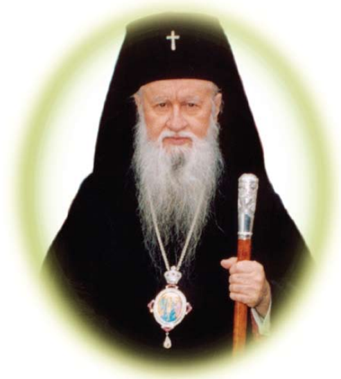
Ὁ Σεβασμιώτατος Μητροπολίτης † Ὠρωποῦ καὶ Φυλῆς κ. Κυπριανὸς Πρόεδρος τῆς Ἱερᾶς Συνόδου τῶν Ἐνισταμένων