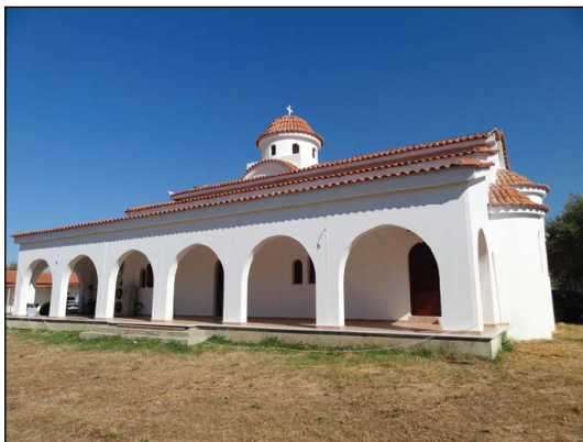
Ἱερὸς Ναὸς Παναγίας Γιάτρισσας Ἀσπροχώματος Καλαμάτας.