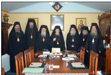
Соборъ Іерархіи Священнаго Синода Противостоящихъ, окт. 2013 г.