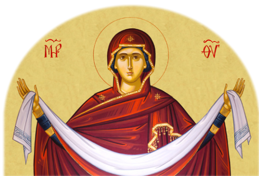
Ἡ Σκέπη τῆς Παναγίας

Σεβασμιώτατε Μητροπολίτα καὶ Πνευματικέ μας Πατέρα· Ἅγιοι Ἀρχιερεῖς· Σεβαστοὶ Πατέρες καὶ Μητέρες· Ἀγαπητοὶ ἐν Χριστῷ Ἀδελφοὶ καὶ Ἀδελφές·