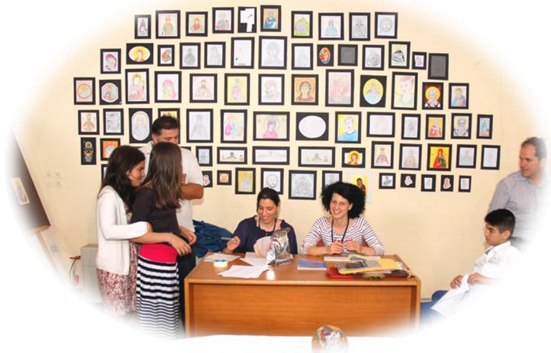
Έκθέματα του Παιδικού Τμήματος στην μικρή Έκθεση της Τελετής Λήξης Μαθημάτων