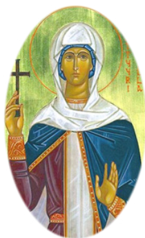
Ἡ Ἁγία Πρίσκιλλα.