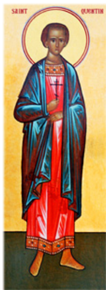
Ὁ Ἅγιος Κουεντίνος.

Υ ἱὸς ἑνὸς Ρωμαίου Ἄρχοντος, ὁ Κουεντίνος ἐζήτησε τὴν εὐλογία τοῦ Ἁγίου Γαΐου Πάπα Ρώμης (283-296, † Μνήμη: 22α Ἀπριλίου), γιὰ νὰ ἐπιχειρήσῃ τὸν εὐαγγελισμό τῶν κατοίκων τῆς χώρας τῶν Ἀμβιανῶν, περιοχῆς τῆς σημερινῆς Πικαρδίας.