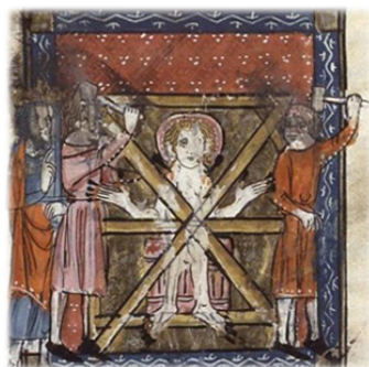
Τὸ μαρτύριο τοῦ Ἁγίου Κουεντίνου.

Τότε ὁ τύραννος σὲ ἓναν παροξυσμὸ ὀμότητος, παρήγγειλε νὰ περάσουν τὸ