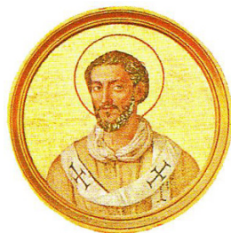
Ὁ Ἅγιος Γαῖος, Πάπας Ρώμης.