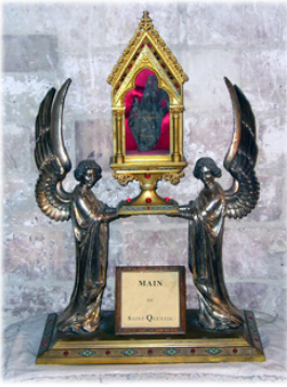
Ἱερὰ Λείψανα τοῦ Ἁγίου Κουεντίνου. Μάρτυρος προσεΐλκυε.

Ἄφου ἀνεκομίσθησαν τὰ ἅγια Λείψανα, οἱ πιστοὶ ἀπεφάσισαν νὰ μεταφέρουν αὐτὰ στὴν πόλι Βερμάνδ. Ἄφου ὁμως διήνυσαν μίαν μικρὰ ἀπόστασι, τὰ ἱερὰ Λείψανα ἔγιναν ὑπερβολικὰ βαρειά, ὥστε κατέστη ἀδυνατὸν νὰ προχωρήσῃ ἡ ἄμαξα.