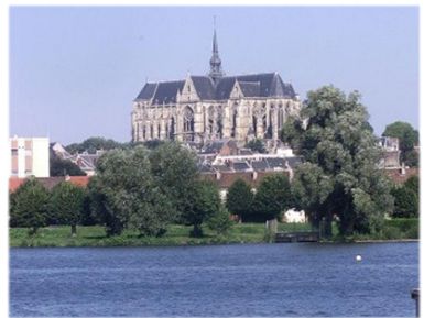
Ὁ καθεδρικός Ναὸς πρὸς τιμὴν τοῦ Ἁγίου Κουεντίνου. Σέντ-Κεντέν.

Πράγματι ἡ εὐσεβῆς δούλη τοῦ Θεοῦ μετέβη στὴν Αὐγούστα καὶ κατέβη στὸν ποταμὸ Σάμαρα. Ἐκείνη τὴν ᾠρα ἀνεδύθησαν ἀπὸ τὰ ὕδατα ἡ ἱερὰ κεφαλὴ καὶ τὸ ὑπόλοιπο σκῆνωμα τοῦ Ἁγίου καὶ οἱ ὀφθαλμοὶ τῆς Εὐσε- βίας ἠνοιχθησαν.