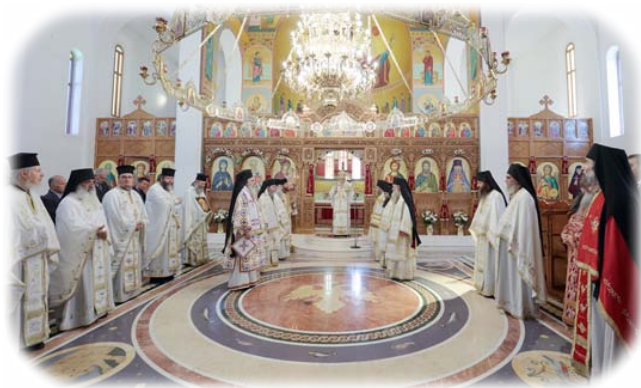
Ἀπὸ τὴν Πανήγυρι τῆς Ἱερᾶς Μονῆς τῶν Ἁγίων Κυπριανοῦ καὶ Ἰουστίνης, Φυλὴ Ἀττικῆς. 2α Ὀκτωβρίου 2017 ἐκ. ἡμ.