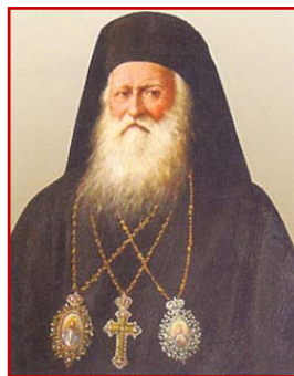
Πατριάρχης Κύριλλος Β΄

Στὸ βιβλίο περιέχεται ἐπίσης καὶ μία ἱστορική-ἀρχαιολογική ἔρευνα σχετικὰ μὲ τὴν ἀρχική μορφή τοῦ Τάφου τοῦ Ἰησοῦ καὶ τοῦ βράχου τοῦ Γολγοθᾶ, μαζί μὲ μία σειρά ἀναπαραστάσεων τῶν δύο τοποθεσιῶν, ὅπως φαίνονταν τὸ ἔτος 33 μ.Χ.