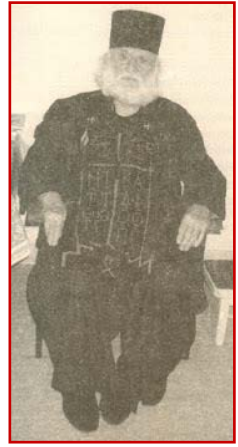
Ὁ Ἁγιοπαῖτης Γέρο-Μητροφάνης