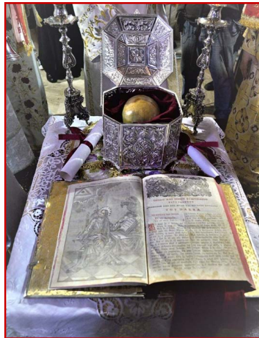
Ἡ ἱερὰ Κάρα τοῦ Ἁγίου Ἰωάννου τοῦ Νέου Ἐλεήμονος.

(*) Ἐχετε τὴν δυνατότητα νὰ ἰδῆτε τὴν Ἀκολουθία τοῦ Ἁγίου Ἰωάννου σὲ ἠλεκτρονικὴ μορφή ἑδῶ , ὡς καὶ τὸ Χρονικὸ Ἀνακηρύξεως τῆς Ἀγιότητος Αὐτοῦ ἑδῶ .