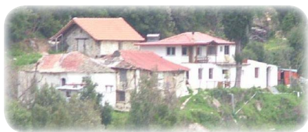
Τὸ Ἱερὸ Κελλίον τοῦ Ἁγίου Βασιλείου.

σικόν-ἀμαξιτὸν δρόμον τῆς Ἱερᾶς Μονῆς Παντοκράτορος καὶ πρὸς Ἀνατολὰς ἀπὸ τὴν Γέφυραν τοῦ Λάκκου (πρὸς Ἰβήρων) μέχρι τῆς τομῆς τοῦ δρόμου πρὸς τὴν Ἱ. Μ. Παντοκράτορος καὶ τοῦ ἀνωτέρω