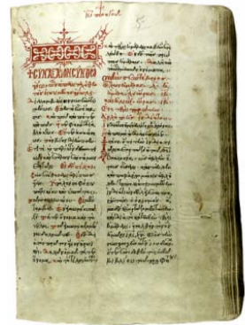
Αὐτόγραφος Συναξαριστῆς τοῦ Ὁσίου Θεοφίλου. Κωδ. Παντοκράτορος 85, ἔτους 1538.