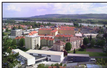
Οί φυλακές Στάϊν σήμερα.

Ε πικεντρώνεται στην σφαγή που έγινε, λίγο πριν από το τέλος του πολέμου, στην εν λόγω φυλακή, ή οποία από τις αρχές του 1944 ήταν ασφυκτικά γεμάτη, κυρίως, από αντιστασιακούς που προέρχονταν από ολόκληρη την Ευρώπη.