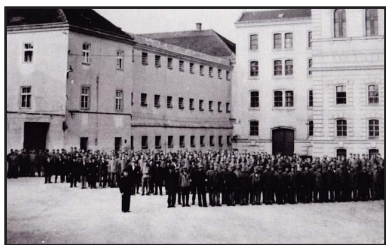
Άναφορά κρατουμένων στο προαύλιο τῆς φυλακῆς.

● Σήμερα θυμίζου­ν τὸ γε­γονὸς 386 σταυροὶ ποὺ τοποθε­τή­θη­καν, τὸν Ἀπρί­λιο τοῦ 1995, γύρω ἀπὸ τὸ σωφρο­νισ­τι­κὸ Ἰδρυ­μα Στάϊν.