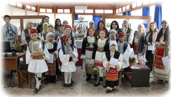
Τὰ «Λαζαράκια». † Σάββατον τοῦ Λαζάρου, 18η Μαρτίου 2018 ἐκ. ἡμ.