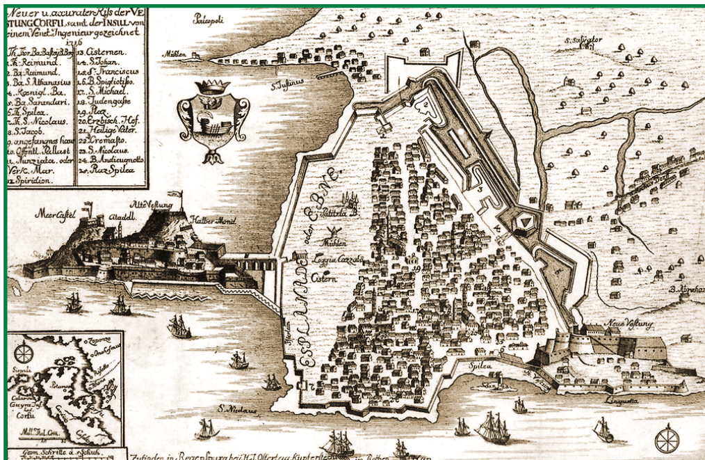
Άποψις τῆς πόλεως Κερκύρας καὶ τοῦ παρακειμένου νησιδίου, εἰς τὸ ὁποῖον ἔγινεν ἡ «Οὐρανοῦ Κρίσις». Χάρτης τοῦ 1716.