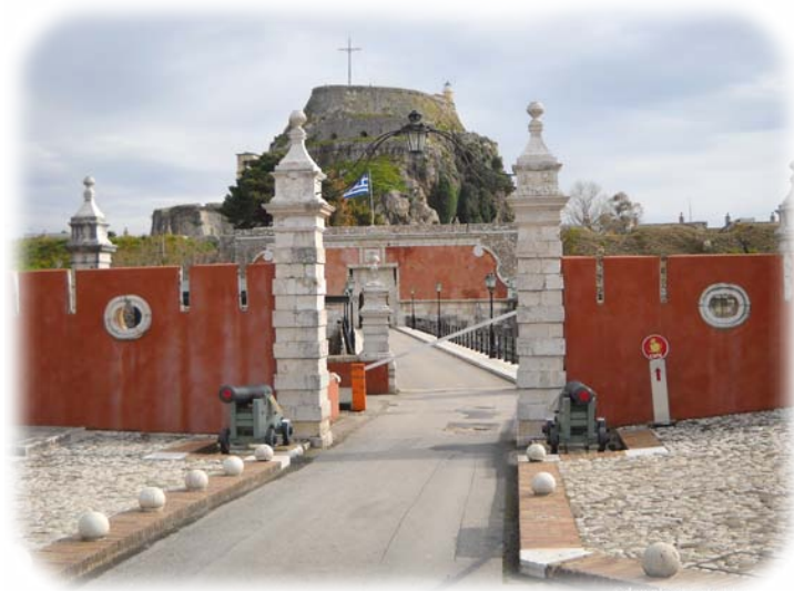
Ἡ εἴσοδος τοῦ Παλαιοῦ Φρουρίου εἰς τὸ νησίδιον τῆς Κερκύρας.