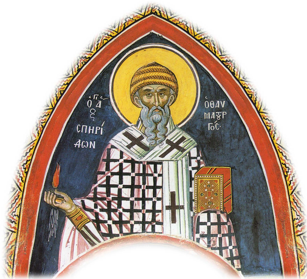
Ἱερὰ Εἰκὼν τοῦ Ἁγίου Σπυρίδωνος. Ἱερὰ Μονὴ Διονυσίου, Ἅγιον Ὄρος.