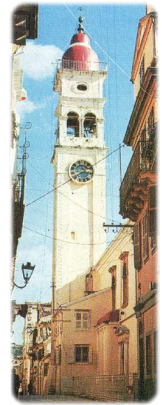
Μ έρος τοῦ Ναοῦ τοῦ Ἁγίου Σπυρίδωνος εἰς τὴν πόλιν τῆς Κερκύρας, μὲ τὸ πανύψηλον κωδωνοστάσιον, ἀπὸ τὴν κορυφὴν τοῦ ὁποίου ἐξεπέμφθη λάμψις πυρός πρὸς τὴν πυριτιδαποθήκην, τὴν νύκτα τῆς 11-12.11.1718.