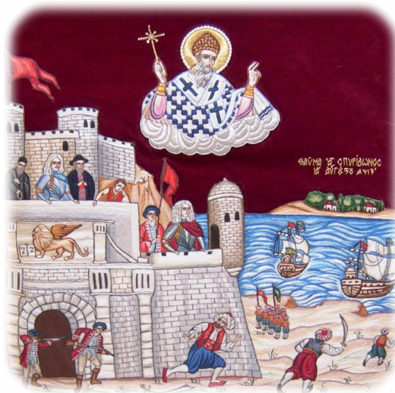
Ὁ Ἅγιος Σπυρίδων διώκων τοὺς Τούρκους. Κ έρκυρα. 11η Αὐγούστου 1716.

Ὁ πωσδήποτε, στὶς 12 Αὐγούστου ἡ Κέρκυρα διέφευγε τὸν κίνδυνο. Κ αὶ ἡ Βενετία κέρδιζε –ἔστω καὶ μὲ ξένο στρατιωτικὸ ἡγέτη– τὴν τελευταία, μεγάλη πολεμικὴ ἐπιτυχία τῆς ἱστορίας της, κύκνειο ἄσμα τῆς γηραιᾶς πια Γαληνοτάτης Δημοκρατίας ποὺ πλησίαζε ἤδη πρὸς τὴν ὀριστικὴ της δύση. Δ ικαιολογημένα λοιπὸν ἡ βενετικὴ κυβέρνησις πανηγύρισε μὲ λαμπρότητα τὴ νίκη, ἀπονέμοντας ταυτόχρονα στὸν Schulemburg τιμές, ἀνάλογες μὲ ἐκεῖνες ποὺ εἶχαν δοθῆ στὸν Morosini πρὶν τριάντα χρόνια.