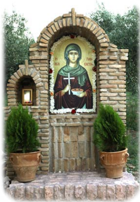
Προσκυνητάριον τῆς Ἁγίας Παρασκευῆς, εἰς τὴν ὁμώνυμον Ἱερὰν Μονήν, εἰς Ἀχαρνὰς Ἀττικῆς.