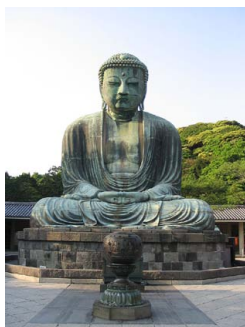
Ὁ Βούδας Νταϊμπούτσου (Buddha Daibutsu) στήν Καμακούρα τῆς Ἰαπωνίας. Μπρούτζινο ἄγαλμα ὕψους 11,40 μ. καί βάρους 93 τ.

« Π αρουσιάζεται ὁμως ἐνώπιόν του, ἀκόμη ἓνα μονοπάτι, τὸ μονοπάτι τῆς ἀπάρνησης, ἡ θεληματικὴ ἀποδοχὴ τῆς γήϊνης ζωῆς γιὰ τὴν ἀγάπη τῆς Φυλῆς... Ὅ ταν ὁ δάσκαλος διαλέξει νὰ δεχθεῖ τὴν ἐνσάρκωση, ὥσπου νὰ τελειώσει ὁ προορισμὸς τῆς Φυλῆς, τοῦτο εἶναι τὸ στεφάνωμά του». Ἡ θεληματικὴ αὐτὴ μετενσάρκωσή του (ποῦ δὲν εἶναι γι' αὐτὸν ἀναγκαία) εἶναι μιὰ «Μεγάλῃ Ἀπάρνηση». Αὐ τὲς οἱ «Τελειωμένες Ὀντότητες» ἐπανερχοῦνται πλέον σὲ «ἠθελημένη» μετενσάρκωση γιὰ νὰ γίνουν «Ἐκπαιδευταί, γιὰ νὰ βοηθήσουν τὴν παλαιούσα ἀνθρωπότητα στὴν ὁδὸ τῆς πνευματικῆς ἐξελίξεως» 12 . Τ ότε, οἱ