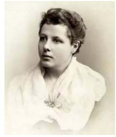
Ἄννα Μπεζάντ (Annie Besant, 1847-1933).

Μ ετὰ τὸν βιολογικὸ θάνατο, ἡ «ψυχὴ» (τὸ μὴ θνητὸ στοιχεῖο τοῦ ἀνθρώπου, κατὰ τοὺς «μετενσαρκωτὲς») παραμένει γιὰ κάποιον χρονικὸ διάστημα σὲ κάποιον οὐράνιο (ἀστρικό) κόσμο. Ἡ περίοδος αὐτὴ ὀνομάζεται «περίοδος ἀποσάρκωσης», ἢ «Δεβαχανικὴ περίοδος», εἶναι ἡ περίοδος πὺ τὸ «Ἐγὼ» «ξαναμπαίνει στὸν ἑαυτὸ του» καὶ «εἶναι ὁ ἀναγκαῖος χρόνος πὺ ἀπαιτεῖται γιὰ τὴν ἀφομίωση τῆς ἐμπειρίας καὶ τὴν ἀπόκτηση ἰσορροπίας ἀπὸ τὸ “Ἐγὼ”», ἢ τὸν «Διανοητὴ», ὅπως τὸ ὀνομάζει ἡ Μπεζάντ. Αὐτὸς ὁ «Διανοητὴς» ἐνσαρκώνεται καὶ ὄχι «ὁ ἄνθρωπος-κτῆνος» 8 .