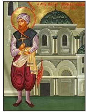
Ὁ Ἅγιος Μάρτυρας Τουνὸμ καὶ στὸ βάθος ὁ κίονας ποὺ ἀνεφλέγη. I.M. Μεγάλης Παναγίας, Ἱεροσόλυμα.

Στὰ θαυμάσια ὅμως τοῦ Θεοῦ τὸ πρῶτο λόγο ἔχει ἡ πίστη καὶ ὄχι ἡ λογικὴ. Μιὰ ματιὰ στὶς εὐαγγελικὲς διηγήσεις θὰ δοῦμε πλειστάκις νὰ διατυπώνεται ἀπὸ τὰ χεῖλη τοῦ Χριστοῦ ἡ θέση αὐτὴ. Γιατὶ ἡ πίστη θέλει καρδιά. Τότε μονάχα ἐνεργοποιεῖται καὶ μέσα ἀπ' τὶς ὑπέρλογες διαστάσεις της βεβαιώνονται τὰ ἐλπιζόμενα καὶ προσεγγίζονται τὰ μὴ ἔχοντα ὑπόσταση. Με τὴν κραυγὴ τοῦ «πρόσθεσ ἡμῖν πίστιν», ἅς ἀνάψουμε τὸ ἁγιοκέρι μας μὲ τὸ Ἅγιο Φῶς, καὶ νὰ ζητήσουμε ἐπίμονα ἀπὸ τὸν Ἀναστάντα Κύριό μας νὰ διατηρεῖ τὶς καρδιές μας φλεγόμενες στὴν προσωπικὴ συνοδοιπορία μαζί Του πρὸς τὴν αἰώνια Ἑμμαούς. Ἀμήν.