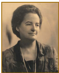
Alice Bailey (1880-1949).

Η «Νέα Έποχή», όπως είπαμε γαλουχήθηκε και προωθείται κυρίως, από τη Θεοσοφική Σχολή της αποκρυφίστριας Έλενας Μπλαβάτσκυ (ιδρύτριας της Θεοσοφικής Σχολής, τὸ ἔτος 1875) και από τους διάδοχούς της και επαγγέλλεται, ἐκτὸς τῶν ἄλλων, ὅπως και ἐκείνη, τὴν ἐγκαθίδρυση μιᾶς «Νέας Παγκόσμιας Θρησκείας» (συγκρητισμός).