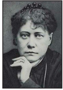
Helena Petrovna Blavatsky (1831-1891).

Από τους δέκα πέντε μεσσίες-χριστούς της Νέας Έποχής που έμφανίστηκαν κατά την τελευταία 40ετία ένας ή δύο πλέον έπιζούν 22 .