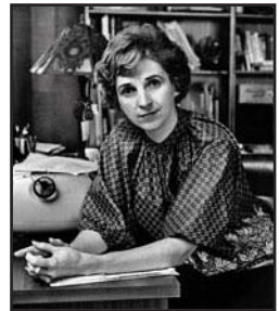
Marilyn Fergusson (1938-2008).

Ἡ Marilyn Fergusson, βασική ἐκφραστής τῆς «Νέας Ἐποχῆς», τὴν ὀνομάζει «συνωμο- σία τοῦ ὕδροχόου» 11 καὶ «κίνηση πὺν δὲν ἔχει ὄνομα» 12 .