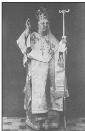
Ὁ Σεβασμ. Ταλαντίου Ἀκάκιος († 1963).

ἔτη ὁ Σεβασμ. Ἐπίσκοπος Ταλαντίου Ἀκάκιος θὰ ἐξεύρισκε ἄλλον Ἀρχιερέα ἀπὸ τοὺς Ρώσους, ὥστε μαζί του νὰ προβεῖ στὴν Χειροτονία καὶ ἄλλων ὑποψηφίων γιὰ σύσταση Ἱεραρχίας.