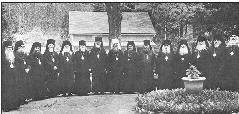
Ἡ Ἱερὰ Σύνοδος τῆς Ρωσικῆς Διασπορᾶς ὑπὸ τὸν Ἅγιο Μητροπολίτη Φιλάρετο (περὶ τὸ 1970).