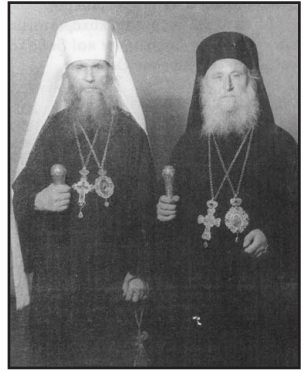
Ὁ Ἅγιος Μητροπολίτης Φιλάρετος μὲ τὸν Ἀρχι- ἐπίσκοπο Αὐξέντιο.

Κάποιοι ἀπὸ τοὺς πολεμίους, τότε καὶ ἀργότερα, κατηγορήσαν ἀναίσχυντα τὶς Χειροτονίες τῶν Ἀρχιερέων μας ὡς «σιμωνιακές», δηλαδή ὅτι ἔγιναν μὲ χρηματικὸ ἀντάλλαγμα, ἀλλὰ ἡ κατηγορία εἶναι ψευδέστατη καὶ ἀστήρικτη, ἀφοῦ δὲν ὑπῆρχαν χρήματα στὴν Ἐκκλησία μας οὔτε γιὰ τὴν ἀγορὰ τῶν ἀναγκαίων ἀεροπορικῶν εἰσιτηρίων γιὰ τὸ ταξίδι ἐλεύσεως καὶ ἀναχωρήσεως τοῦ κατὰ Θεὸν Εὐεργέτου μας!