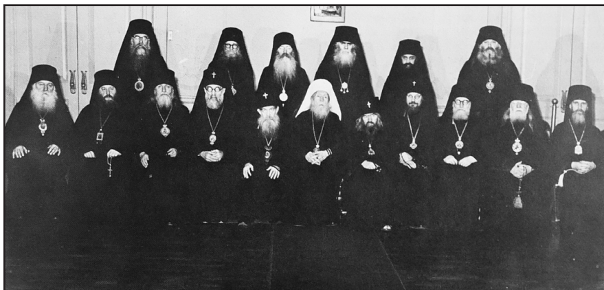
Ἡ Ἱερὰ Σύνοδος τῆς Ρωσικῆς Διασποράς (1962).