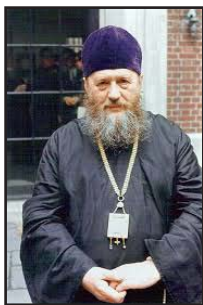
Ὁ Σεβασμ. Χιλῆς καὶ Περού Λεόν- τιος († 1971).

ρικτὲς τοὺς πλέον ἐξέχοντες ἀπὸ τοὺς Ἀρχιερεῖς τῆς Συνόδου, ὅπως τὸν Ἅγιο Ἀρχιεπίσκοπο Ἰωάννη (Μαξίμοβιτς), τὸν Ἀρχιεπίσκοπο Συρακουσῶν καὶ Τριάδος Ἀβέρκιο (Τάουσεφ) κ.ἄ.