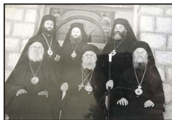
Ἡ Ἱερὰ Σύνοδος τῆς Ἐκκλησίας μας ὑπὸ τὸν Ταλαντίου Ἀκάκιο (1962).

Ἐ Σεβασμ. Λεόντιος ἐξέφρασε προθυμία νὰ σπεύσει νὰ βοηθήσει τοὺς Ἑλληνες ὁμοπίστους συναγωνιστὲς Ἀδελφοὺς στὴν ἀνάγκη τους καὶ ἐφ' ὅσον αὐτοὶ ἀδυνατοῦσαν νὰ ταξιδεύσουν στὴν Νότιο Ἀμερικὴ, προσφέρθηκε νὰ ἔλθει στὴν Ἑλλάδα γιὰ τὸ ἱερὸ αὐτὸ σκοπὸ.