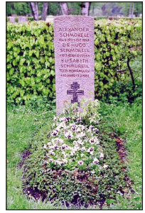
Ὁ τάφος τοῦ Ἀλέξανδρου Schmorell στὸ Μόναχο.