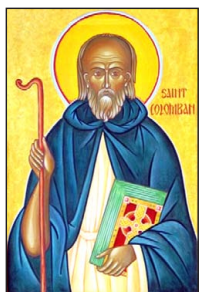
Ὁ Ἅγιος Κολομβανός.

κατοίκους τῆς περιοχῆς πού θέλησαν νὰ τοὺς θανατώσουν.