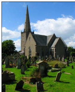
Ἡ Μονὴ Μπάγκορ.

Ἀργότερα, πῆγε καὶ τοὺς βρῆκε ἐκεῖ ὁ Ἅγιος Κολομβανὸς καὶ ὅλοι μαζί ἀνέπλευσαν τὸν Ρῆνο ποταμὸ καὶ εἰσῆλθαν στὰ ἐδάφη τῶν Ἑλβετῶν, στὶς ὄχθες τῆς λίμνης τῆς Ζυρίχης, ὅπου ἤλθαν ἀντιμέτωποι μὲ τοὺς βάρβαρους