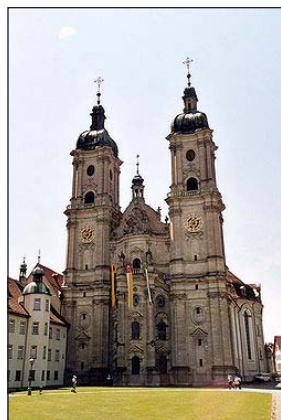
Ἡ Μονὴ τοῦ Ἁγίου Γάλλου. Ἑλβετία.