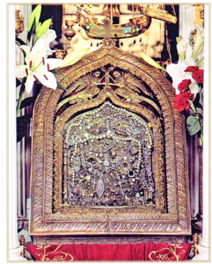
Ἡ ΜΕΓΑΛΟΧΑΡῆ ΤῆΝΟΣ

Παναγία ἡ Πελαγονίτισσα - Ἡ Παναγία τῶν Μοναστηριωτῶν.