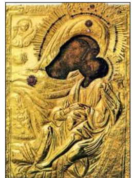
Παναγία ἡ Λιμνιά.

Ἡ Παναγία καὶ τὰ τάνκς τῶν Ναζί. Ἔνα θαῦμα τῆς Παναγίας τῆς Σκριποῦς στὸν Ὀρχομενὸ Βοιωτίας, 10 Σεπτεμβρίου 1943.