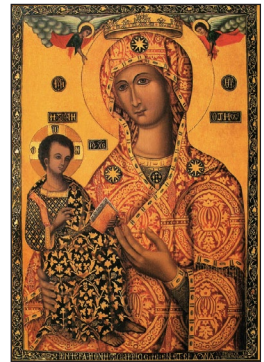
Παναγία ἡ Τροοδίτισσα.