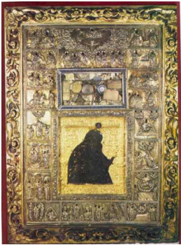
Παναγία τοῦ Ἀκαθίστου.