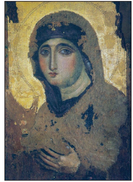
Παναγία ἢ Ἀγιοσορίτισσα. Σήμερα εὑρίσκεται στὴν Ρώμη, στὸν Ναὸ Chiesa di Santa Maria del Rosario a Monte Mario.