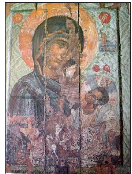
Παναγία ἡ Ἀχειροποίητος ἡ Ἀβραμιώτισσα.