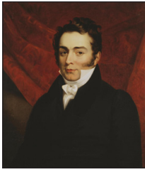
Αλεξάντερ Ίβανοβιτς Ριμπιουπιερρέ. (1781-1865)