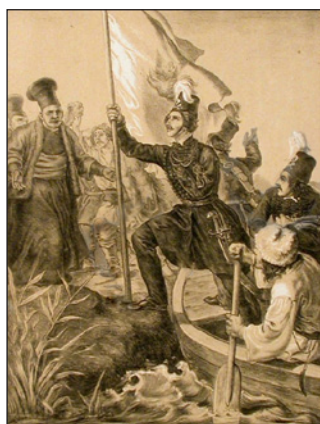
Ἡ διάβασις τοῦ ποταμοῦ Προῦθου στὴν Μολδαβία ἀπὸ τὸν Ἀλέξανδρο Ὑψηλάντη τὸν Φεβρουάριον τοῦ 1821. Λιθογραφία τοῦ Peter von Hess, Μόναχο, 1852.

Τὸ σχέδιο τῆς Φιλικῆς Ἐταιρείας ἦταν νὰ γίνῃ κυκλωτικὴ κίνησις μὲ τελικὸ στόχο τὴν Κωνσταντινούπολι. Ὁ Πρίγκιψ Ἀλέξανδρος Ὑψηλάντης, ὑπασπιστὴς τοῦ Τσάρου καὶ ἡρωϊκὸς Ἀξιωματικὸς μέχρι τότε τοῦ Ρωσικοῦ Στρατοῦ, ἀνέλαβε νὰ ξεσηκώσῃ τοὺς Ἕλληνες τῆς Μολδαβίας καὶ τῆς Βλαχίας καθὼς καὶ τὸν τοπικὸ Ρουμανικὸ πληθυσμὸ. Ἡ περιοχὴ ἐπετέλεγε, διότι δὲν ὑπῆρχε πολυάριθμος Τουρκικὸς Στρατός. Οἱ Ἡγεμόνες, οἱ ὅποιοι ἐστέλλοντο ἀπὸ τὴν ὑψηλὴ Πύλη (Σουλτᾶνο) ἦσαν Χριστιανοὶ καὶ κατὰ κανόνα Φαναριῶτες Ἕλληνες. Παραλλήλως