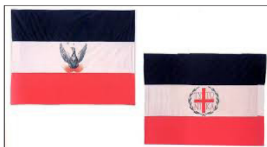
Όμοίωμα τῆς πρώτης ἐπαναστατικῆς σημαίας, πὸν ὕψωσε ὁ Ὑψηλάντης στὸ Ἰάσιο.

εἶχαν εἰδοποιηθῆ οἱ Κληρικοὶ καὶ οἱ Πρόκριτοι τῆς Πελοποννήσου νὰ εἶναι ἔτοιμοι νὰ κινηθοῦν στὶς 25 Μαρτίου, τὴν ἡμέρα τοῦ Εὐαγγελισμοῦ τῆς Θεοτόκου. Μ ολδοβλαχία καὶ Πελοπόννησος θὰ ἦταν ἡ ἀρχικὴ τανάλια, ἡ ὁποία θὰ περιέσφιγγε τοὺς Ὀθωμανούς.