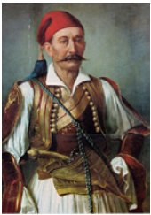
Νικόλαος Στουρνάρης (1775-1826).