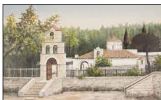
Μονὴ τοῦ Ἁγίου Συμεών.

Όταν ὅλα ἦταν ἔτοιμα γιὰ τὴν Ἔξοδο, «ὁ περιπαθέστερος ἀποχαιρετισμὸς ἀπὸ ὅσους μνημονεύει ἡ ἱστορία ἐγένετο». Σ υνταρακτικὲς σκηνὲς περιγράφονται. Π ολλοὶ συγγενεῖς, φίλοι καὶ κυρίως γυναῖκες τὴν τελευταία στιγμή