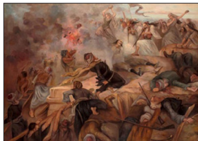
Ἡ Μάχη τῶν Χριστουγέννων κατὰ τὴν πρώτη πολιορκία τοῦ Μεσολογγίου τὸ 1822. Ἔργο τοῦ Γάλλου ζωγράφου Alphonse de Neuville (1835-1885).

Σ τὰ μέσα τοῦ 1823 οἱ τουρκικὲς δυνάμεις σχεδίασαν νέα ἐκστρατεία πὺν περιλάμβανε πολιορκία καὶ κατάληψη τοῦ Μεσολογγίου. Μετὰ ἀπὸ σκληρὲς μάχες πὺν δόθηκαν στὴν περιοχή τῆς Εὐρυτανίας, τὰ τουρκικὰ στρατεύματα κατευθύνθηκαν πρὸς τὸ Μεσολόγγι. Οἱ ἀρχὲς καὶ οἱ κάτοικοι τῆς πόλης προετοιμάστηκαν γιὰ πολιορκία, ὅμως