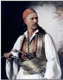
Δημήτριος Μακρῆς (1772-1841).

Β λέποντες τὸν ἑαυτὸν μας, τὸ στράτευμα καὶ τοὺς πολίτας ἐν γένει μικροὺς καὶ μεγάλους παρ' ἐλπίδα νστερημένους ἀπὸ ὅλα τὰ καταπείγοντα ἀναγκαῖα τῆς ζωῆς πρὸ 40 ἡμέρας καὶ ὅτι εκπληρώσαμεν τὰ χρέη μᾶς ὡς πιστοὶ στρατιῶται τῆς πατρίδος εἰς τὴν στενὴν πολιορκίαν ταύτην καὶ ὅτι, ἐὰν μίαν ἡμέραν ὑπομείνωμεν περισσότερον, θέλομεν ἀποθάνει ὄρθιοι εἰς τοὺς δρόμους ὅλοι.