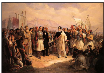
Υποδοχή του Λόρδου Μπαίρον στο Μεσολόγγι.

πού έχει τον τίτλο «Τὸ προσκύνημα τοῦ Τσαΐλντ Χάρολντ», δίνει ωραιότατες περιγραφές τῆς Ἠπείρου. Ἐχωριστὴ θέση ἔχει ἓνα ποίημα, ὅπου περιγράφει μίᾳ θύελλα, πού τὸν βρῆκε στὴν Ζίτσα τῆς Ἠπείρου.