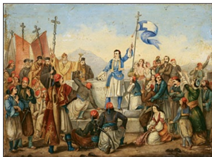
Ὁ Λόρδος Μπαίρον στὸν τάφο τοῦ Μάρκου Μπότσαρη.

Ὁ Βύρων ἦταν ὁμορφος ἄνδρας μὲ πυκνὰ πυρόξανθα σγουρὰ μαλλιά καὶ ωραῖο παράστημα, ἂν καὶ λίγο κουτσὸς ἀπὸ τὸ δεξί του πόδι. Οἱ ἐρωτικές του περιπέτειες ἄφησαν ἐποχὴ στὸ Λονδίνο καὶ ἡ περιφρόνησή του γιὰ τὶς κοινωνικὲς συμβάσεις δημιούργησαν μικρὰ καὶ μεγάλα σκάνδαλα. Ἀπὸ τὸν σύντομο γάμο του μὲ τὴν Ἀναμπέλα Μίλμπανκ ἀπέκτησε μίᾳ κόρη, τὴν Ἄντα Λάβλεις, μετέπειτα διάσημη μαθηματικὴ, πού θεωρεῖται ἀπὸ τοὺς πρωτοπόρους τῆς πληροφορικής. Ἀπὸ τὴν σχέση του μὲ τὴν Κλέρ Κλέμοντ, ἀπέκτησε καὶ μίᾳ δευτέρῃ κόρη, τὴν Κλάρα Ἀλέγκρα, ἡ ὁποία πέθανε σὲ ἡλικία πέντε χρονῶν.