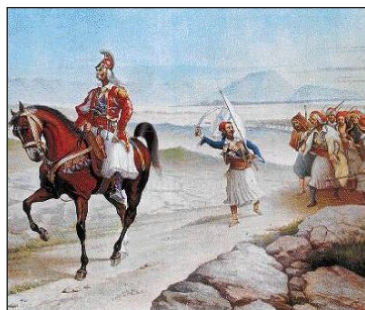
Ὁ Κολοκοτρῶνης ὀδηγεῖ τὸν στρατὸ του πρὸς τὸ Βαλτέτσι.

μενες από τὸ Ναύπλιο ἐπιτέθηκαν κατὰ τῶν Ἑλλήνων. Ὁ τουρκικὸς αἰφνιδιασμὸς ἀνάγκασε τοὺς ὑπερασπιστὲς τοῦ ὑπὸ τὸν Κυριακούλη Μαυρομιχάλη νὰ ἀποσυρθοῦν, μὲ ἀποτέλεσμα τὸ χωριὸ νὰ πυρποληθεῖ. Ὁ Κολοκοτρῶνης, πού εἶχε ὑποθέσει ὅτι οἱ Τούρκοι θὰ κατεϋθύνονταν πρὸς ἓνα ἄλλο ἑλληνικὸ στρατόπεδο στὰ Βέρβαινα, ἔσπευσε στὸ Βαλτέτσι καὶ ἀνασυγκρότησε τὸ στρατόπεδο.