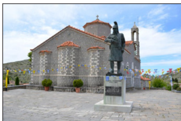
Ἀδριάντας Θεοδώρου Κολοκοτρώνη στὸ Βαλτέτσι.

Τὸ πρωῒ ἡ μάχη συνεχίσθηκε μετὰ τὴν σφοδρότητα τῆς προηγουμένης. Χαρακτηριστικοὶ εἶναι οἱ στίχοι τοῦ λαϊκοῦ ποιητῆ Παναγιώτη Καλᾶ ἢ Τσοπανάκου (1789-1825): «... στὸ Βαλτέτσι στὸ Λεβίδι / πέφτει ἀλύπητο λεπίδι... ». Οἱ ἀπόπειρες τῶν Τούρκων νὰ καταλάβουν τοὺς προμαχῶνες ἀποτύγχαναν ἢ μία μετὰ τὴν ἄλλη. Ὁ Μουσταφάμπεης, βλέποντας ὅτι οἱ ἄνδρες τοῦ Ρουμπῆ ἔξακολουθοῦσαν νὰ βρίσκονται σὲ δυσχερῆ θέση καὶ πληροφορούμενος ὅτι ἐπίκεινται νέες ἐνισχύσεις τῶν Ἑλλήνων ἀπὸ τοὺς Νικηταρᾶ καὶ Γιάννη Κολοκοτρώνη, διέταξε ὑποχώρηση ὅλων τῶν δυνάμεών του.