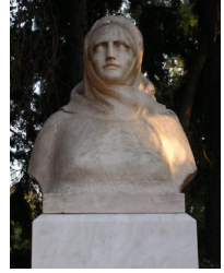
Προτομὴ τῆς Μπουμπουλίνας. Πεδίον τοῦ Ἄρεως.

Οἱ ἀπόγονοι τῆς Μπουμπουλίνας ἐδώρισαν τὸ πλοῖο « Ἀγαμέμνων » στὸ νεοσύστατο κράτος, τὸ ὁποῖο ἔγινε ἡ ναυαρχίδα τοῦ Ἑλληνικοῦ Στόλου μὲ τὸ ὄνομα « Σπέτσαι ». Ἀνατινάχθηκε ἀπὸ τὸν Ἀνδρέα Μιαούλη στὸν Πόρο κατὰ τὴν διάρκεια τῶν πολιτικῶν ταραχῶν τῆς 29ης Ἰουλίου 1831.