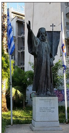
Αδριάντας του Παλαιών Πατρών Γερμανού. Παλαιόμυνη, Πειραιάς.

ἐγκατελείφθη εἰς τὴν διάκρισιν τῶν Ὀθωμανῶν, οἵτινες ὑπέταξαν καὶ τὴν Ἐκκλησίαν καὶ τὸ βασίλειόν της» («Απομνημονεύματα», ἐκδ. «Δρομεύς», σελ. 175).