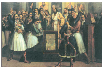
Ὁ Παλαιῶν Πατρῶν Γερμανὸς εὐλογεῖ τὴν ἐπανάσταση.

λῆς ἀπὸ τὰ 1770 ἕως τὰ 1836». Ὑπαγόρευσε ὁ Θεόδωρος Κων. Κολοκοτρῶνης, Ἀθήνησιν, Τύποις Χ. Νικολαΐδου Φιλ. ἀδελφέως, 1846, σελ. 47-48). Ὁ ἀγωνιστὴς καὶ πολιτικὸς Βασ. Ἀθ. Πετιμεζᾶς (1785-1872) γράφει στὴν «Αὐτοβιογραφία» του, ὅτι ἦταν παρὼν στὴν Ἁγία Λαύρα, τὴν 25η Μαρτίου, κατὰ τὴν ὀρκωμοσίᾳ τῶν