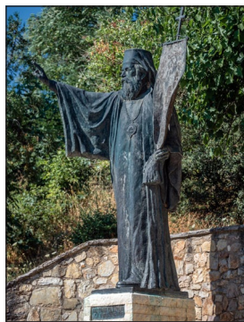
Ἀδριάντας τοῦ Παλαιῶν Πατρῶν Γερμανοῦ. Ἁγία Λαύρα.

Τὸ Ἐκτελεστικὸ στὶς 18/30 Σεπτεμβρίου 1822 καὶ ὕστερα ἀπὸ ἀπόφαση τῆς στῆν Ἐπίδαυρο Α΄ Ἔθνοσυνέλευσης ὄρισε τοὺς Παλαιῶν Πατρῶν Γερμανὸ καὶ Γ. Μαυρο- μιχάλη νὰ μεταβοῦν στῆν Ρώμη, νὰ ἐπι- σκεφθοῦν τὸν Πάπα, νὰ τὸν ἐνημερώσουν γιὰ τὴν Ἐπανάσταση καὶ νὰ ζητήσουν τὴν