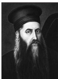
Μητροπολίτης Ἀδριανουπόλεως Δωρόθεος Πρώιος.

Παιδεία. Μ εταξὺ αὐτῶν, στὴν Κωνσταντινούπολη τὸν Μητροπολίτη Ἀδριανουπόλεως Ἅγιο Δωρόθεο Πρώιο, ποὺ οἱ Τοῦρκοι τὸν ἀπαγχόνισαν στὰ Θεραπειά, στὶς 3 Ἰουνίου 1821. Ο Πρώιος ἄφησε μέγα ἔργο κυρίως στὰ Μαθηματικά. Ἐ πίσης εἶχε ἰκανότητα στὴν ἐκμάθηση ξένων γλωσσῶν. Ο Ἅγιος Πατριάρχης Γρηγόριος Ε΄ καταγόταν ἐπίσης ἀπὸ τὴν Δημητσάνα καὶ ἦταν θεῖος τοῦ Γερμανοῦ. Τ ὸν πῆρε κοντά του στὴν Βασιλεύουσα καὶ ὁ Γερμανὸς ἐξελέγη Μητροπολίτης τῆς Πάτρας τὸ 1806. Ἐ κτοτε ἀφιερώνει ὅλες τὶς δυνάμεις του στὸ Ἔθνος καὶ στὴν Ἀναγέννησή του ἐκ τῆς τέφρας.