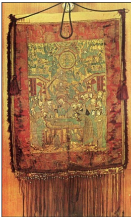
Τὸ χρυσοκέντητο Λάβρο τῆς Ἁγίας Λαύρας.

Ἡ Ἐπανάσταση ξεκίνησε στὰ διάφορα μέρη τῆς Ἑλλάδας ἐντὸς τοῦ Μαρτίου, καὶ κοντὰ στὴν 25η. Σ τὴν Τσακωνιά καὶ στὴν Μάνη στὶς 17 Μαρτίου ξεκινᾷ ὁ Ἀγώνας μὲ Δοξολογίες, ἡ Καλαμάτα ἀπελευθερώνεται στὶς 23 καὶ τελεῖται δοξολογία στὸν ἱστορικὸ Ναὸ τῶν Ἁγίων Ἀποστόλων, στὶς 27 ὁ Σαλῶνων Ἡσαΐας κηρύσσει τὴν Ἐπανάσταση στὴν Ρούμελη μὲ Θεία Λειτουργία καὶ Δοξολογία στὴν Μονὴ τοῦ Ὁσίου Λουκᾶ, στὴν ὁποία παρέστησαν, μεταξὺ ἄλλων, ὁ Ἀθανάσιος Διακός μὲ παλληκάρια του καὶ ἄλλοι ὄπλαρχηγοί. Ο μως ὅλοι οἱ ἀγωνιστές, ὅπου βρέθηκαν, συμμετέσχον στὴν Δοξολογία γιὰ τὴν Ἑορτὴ τοῦ Εὐαγγελισμοῦ καὶ ὅλοι δέχθηκαν τὰ Καλάβρουτα ὡς κοινὸ τόπο ἔναρξης τῆς Ἐπανάστασης, τὴν 25η Μαρτίου ὡς ἡμερομηνία τῆς καὶ τὸν Γερμανό, ὡς τὸν Ἀρχιερέα πού τὴν κήρυξε.