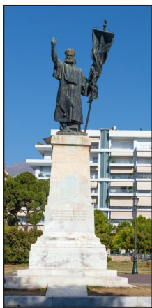
Αδριάντας τοῦ Παλαιῶν Πατρῶν Γερμανοῦ. Καλαμάτα.

μων περιγράφει τὴν σκηνὴ καὶ τὴν χαρακτη- ρίζει «ζωγραφικωτάτη καὶ συγκινητικωτάτη» (Ιω. Φιλήμονος «Δοκίμιον Ἑλληνικῆς Ἐπανάστασεως, Τόμ. Δ΄, σελ. 197).