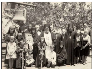
Ο Αρχιεπίσκοπος Λεόντιος στην Χιλή με την θαυματουργή Εικόνα της Παναγίας του Κούρσκ, περ. 1970.

και Μυστηριακή, οδηγεί αναπόφευκτα στην αίσθηση ευθύνης όλων για όλους.