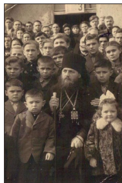
Ὁ Ἐπίσκοπος Λεόντιος στὸ στρατόπεδο ἐκτοπισθέντων μὲ πρόσφυγες συμπατριῶτες του (Ἀμβούργο, 1946).

Τ ὸ γνήσιο Μοναχικὸ φρόνημα τοῦ Ἀρχιεπισκόπου Λεοντίου, ὁ ἱεραποστολικὸς του ζῆλος, ἡ προσήλωσή του στὰ θέσμιμα τῆς Ὁρθοδοξίας, ἡ κατὰ Χριστὸν καλλιέργειά του, ὁ θεοειδὴς χαρακτήρας του, ἡ πραότητα τοῦ πνεύματός του, ἡ ἀγάπη καὶ γλυκύτητά του, ἡ λειτουργικότητά του, ἡ ἀνδρεία καὶ ἀποφασιστικότητά του, ὅλα αὐτὰ τὸν καθιστοῦσαν παντοῦ ἀπὸ ὅπου διήρχετο πόλο ἔλξεως καὶ ἐνδιαφέροντος. Η ἐν Κυρίῳ σύνδεση καὶ ἐγκάρδια φιλία του μὲ τοὺς καλύτερους καὶ ἀγιώτερους Ἀρχιερεῖς τῆς Ρωσικῆς Διασπορᾶς, μὲ πρῶτο καὶ κύριο τὸν Ἅγιο Ἀρχιεπίσκοπο Ἰωάννη Μαξίμοβιτς († 1966), ἀποδεικνύουν πασιφανῶς τὸ μέγεθος τῆς ἀξίας του