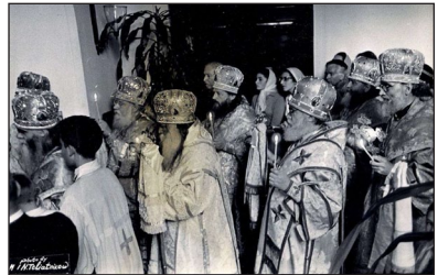
Ἀπὸ Ἀκολουθία κατὰ τὴν διάρκεια τῶν ἐργασιῶν τῆς Συνόδου τοῦ 1959. Στὸ μέσον διακρίνεται ὁ Ἀρχιεπίσκοπος Λεόντιος.

Ἀ κολουθοῦσε τὴν θεμελιώδη ἀρχή, ὅτι ἡ ἐν ἀληθείᾳ Ἐνότης τῆς Ἐκκλησίας καὶ δὴ ἡ Λειτουργικὴ