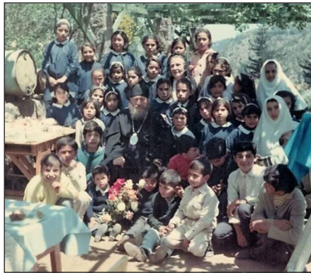
Ὁ Ἀρχιεπίσκοπος Λεόντιος στὴν Χιλὴ ἐν μέσῳ τῶν ἀγαπητῶν του τέκνων. Δεκέμβριος 1969.