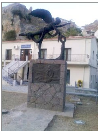
Μνημείο σφαγιασθέντων στην θέση «Εφκάς». Χώρα Σαμοθράκης.

Ἐπανάστασης. Τότε πιθανότατα ἐπέστρεψαν στὸ νησί καὶ ἄρκετοὶ κάτοικοί του.