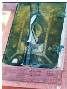
Τὸ «λογιζόμενο Εὐαγγέλιο τῆς Σαμοθράκης», ὅπως εἶχε ἐκτεθεῖ στὴν Βουλὴ τὸ ἔτος 2000.

Μετὰ τὸν «χαλασμό» τῆς Σαμοθράκης, στὸ νησί ἔμειναν περίπου 200 Ἕλληνες. Χρειάστηκαν περίπου δέκα χρόνια γιὰ νὰ βρεῖ τὸ μαρτυρικὸ νησί κάποια «ἰσορροπία». Τὸ 1830, ὁ σουλτᾶνος Μαχμουτ Β' ἐξέδωσε φερμάνι, μὲ τὸ ὁποῖο διέταζε τὴν ἀπελευθέρωση ὄλων τῶν Ἑλλήνων ποὺ εἶχαν αἰχμαλωτιστεῖ στὴν διάρκεια τῆς