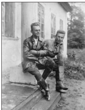
Ὁ Βίτολντ Πιλέτσκι με ἕναν φίλο του στὸ Σουκούρτσε, γύρω στὸ 1930.