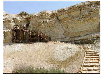
Τὸ Σπήλαιο τῆς Ὁσίας Μαρίας.

Ὁ λοι οἱ ὀρθόδοξοι Χριστιανοὶ εἴμαστε « τετείχισμένοι τῷ ἀγίῳ Βαπτίσματι ». Θ ὰ πρέπει ὁμως νὰ μὴν ἀφήνουμε νὰ δραπετεύη ὁ νοῦς μας ἔξω ἀπ’ αὐτὸ τὸ σωστικὸ τεῖχος, τὴν μεγάλη Χάρη τοῦ Βαπτίσματος , ἀλλὰ νὰ ζητοῦμε ἀπὸ τὸν Θεὸ νὰ ἀκουμπᾶ τοὺς ὀφθαλμοὺς