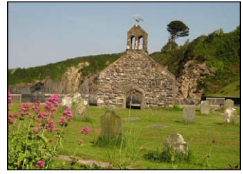
Ἐρείπια Ναοῦ τοῦ Ἁγίου Βρυ- νάχου στὸ Cwm-yr-Eglwys.

ἔστειλε ἓνα γεῦμα μὲ μάγια. Ἡ Χάρις τοῦ Θεοῦ ὁμῶς τὸν ἐπροστάτευσε. Ὄταν δι- επίστωσε ἡ νέα, ὅτι δὲν ἐπέτυχε τὸ τέχνα- σμά της, ἔστειλε στρατιῶτες νὰ τὸν αἰχμα- λωτίσουν καὶ νὰ τὸν φέρουν ἐνώπιόν της. Εἶχαν ἐντολή, ἂν δὲν τὸ καταφέρουν, νὰ τὸν θανατώσουν.