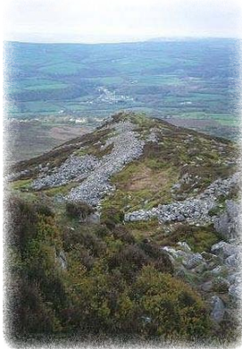
Τὸ Ὄρος τῶν Ἀγγέλων.

Ἡ παράδοσις λέει, ὅτι χωρὶς χρήματα, ἀλ-