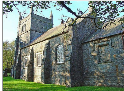
Ναοὶ τοῦ Ἁγίου Βρυνάχου στὸ Νέβερν (ἀριστερὰ) καὶ στὸ Λάνφυρναχ (δεξιὰ).