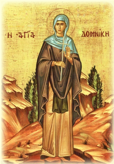
Ἡ Ὁσία Δομνίκη, ἡ ἐκ Καρχηδόνος τῆς Ἀφρικῆς καταγομένη καὶ ἐν ΚΠολει ἀσκήσασα