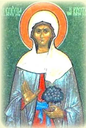
Ἡ Ὅσια Γουδούλα, ἡ Παρθένος ἐν Βρυξέλλες