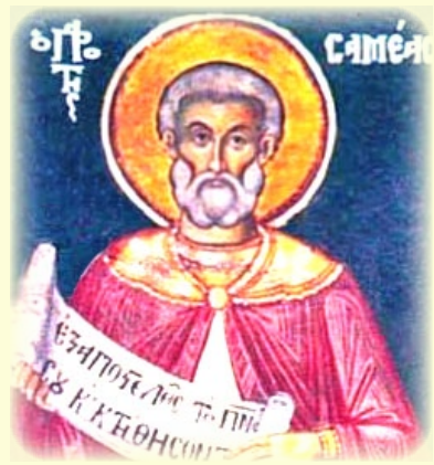
Ὁ Ἅγιος Προφήτης Σαμείας, ὁ Ἐλαμίτης