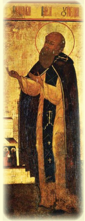
Ὁ Ὅσιος Παῖσιος, ὁ ἐν Οὐγκλιτς