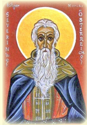
Ὁ Ἅγιος Σεβερῖνος, Ἀπόστολος τῆς Νορικῆς (σημ. Αὐστρία) (βλ. ἐδῶ)