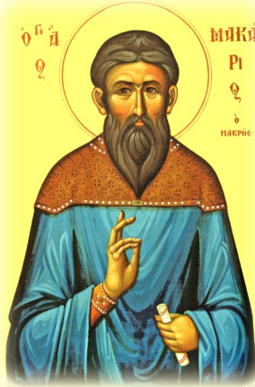
Ὁ Ὅσιος Μακάριος Μακρῆς ὁ Βατο- παιδινός, ὁ μετέπειτα Ἡγούμενος τῆς Ἱ. Μ. Παντοκράτορος ἐν ΚΠόλει