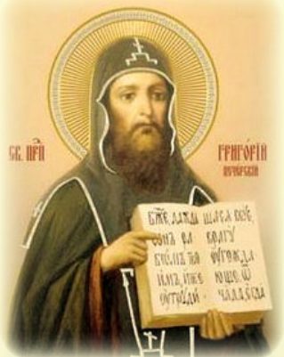
Ὁ Ὅσιος Ἰρηγόριος, ὁ Ἐρημίτης ἐν τῶν Ση- λαίων τοῦ Κιέβου