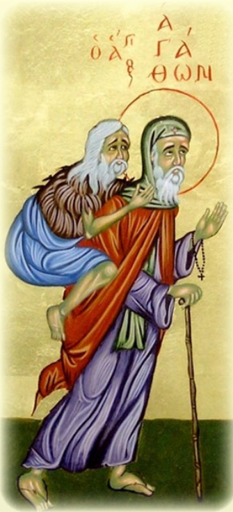
Ὁ Ὅσιος Ἀββᾶς Ἀγάθων