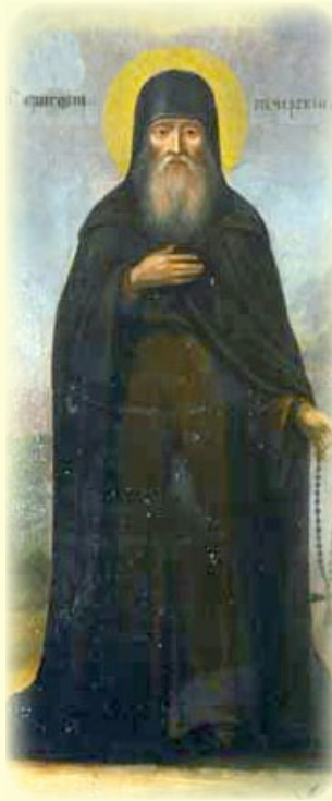
Ὁ Ὅσιος Γρηγόριος, ὁ ἐν τῶν Σηπλαιῶν τοῦ Κιέ- βου, ὁ Θαυματουργός