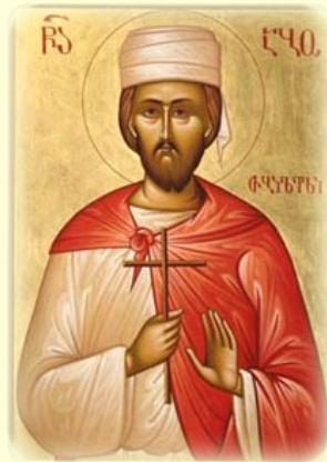
Ὁ Ἅγιος Μάρτυς Ἄμπῳ (ἡ Ἀβῶ) ὁ ἀρωματοποιός, ὁ ἐκ Βαγδάτης καὶ ἐν Τιφλίδι τῆς Γεωργίας μαρτυρήσας