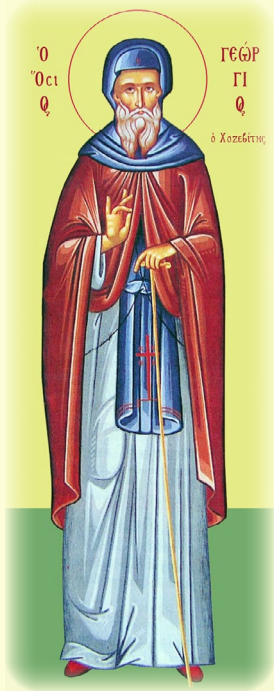
Ὁ Ὅσιος Γεώργιος, ὁ Χοζεβίτης