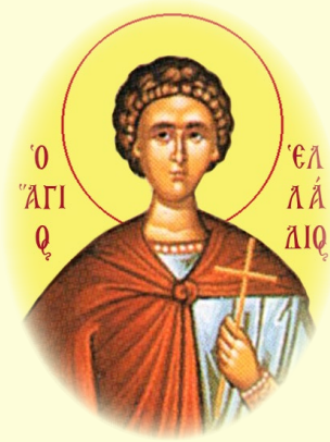
Ὁ Ἅγιος Μάρτυς Ἐλλάδιος, ὁ ἐν τῇ Λιβύῃ