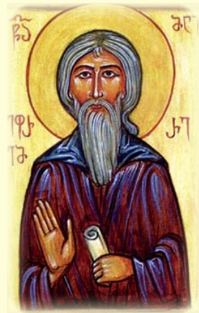
Ὁ Ἅγιος Ἐφραίμ, ὁ Φιλόσοφος ἐκ Γεωργίας