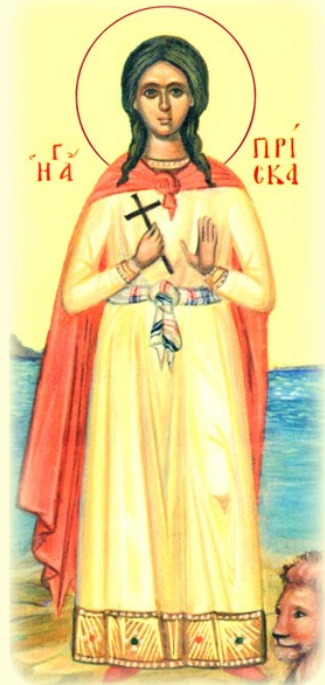
Ἡ Ἅγία Μάρτυς Πρίσκα, ἡ ἐν Ῥώμῃ