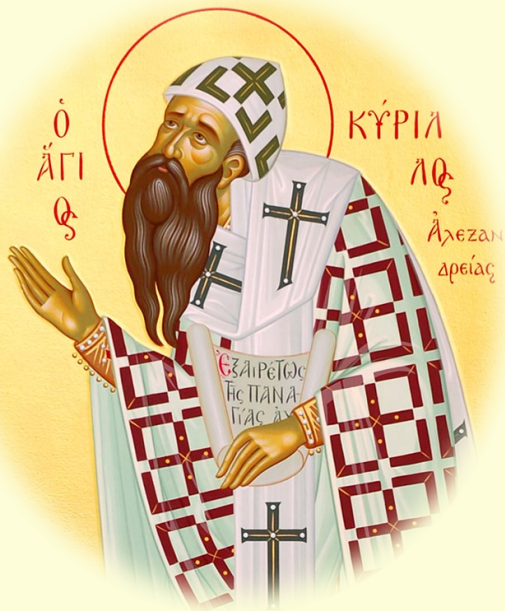
Οἱ Ἅγιοι Ἀθανάσιος καὶ Κύριλλος, Ἀρχιεπίσκοποι Ἀλεξανδρείας