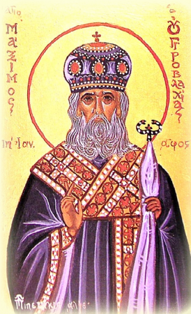
Ὁ Ἅγιος Μάξιμος, Ἡγεμὼν τῆς Σερβίας και Μητροπολίτης Οὐγγροβλαχίας