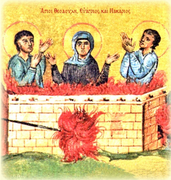
Οἱ Ἅγιοι Μάρτυρες Θεοδούλη Εὐάγριος και Μακάριος