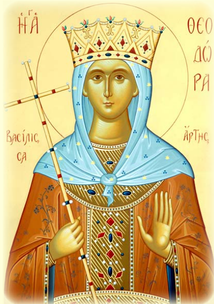
Ἡ Ἅγια Θεοδώρα, ἡ Βασιλισσα ἐν Ἄρτῃ τῆς Ἡπείρου (βλ. ἐδῶ)