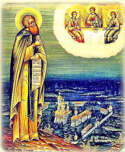
Ὁ Ὅσιος Μαρτύριος, Ἡγούμενος ἐν Ζελενετς τοῦ Πσκῶφ (Ρωσία)