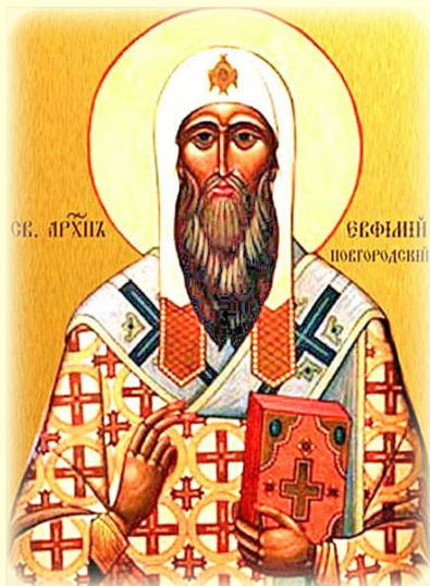
Ὁ Ἅγιος Εὐθύμιος, Ἀρχιεπίσκοπος Νόβγκοροντ, ὁ Θαυματουργὸς (Ρωσία)