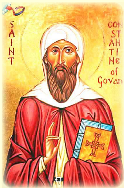
Ὁ Ἅγιος Μάρτυς Κωνσταντῖνος, Βασιλεὺς τῆς Κορνούλης καὶ μετέπειτα Μοναχὸς ἐν Στράθκλαϊντ (Σκωτία)