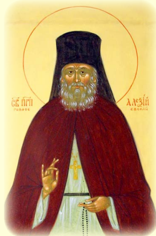
Ὁ Ὁσιος Ἀλέξιος, Στάρης τῆς Ἱερᾶς Σκήτews Γολοσέγιεβο τοῦ Κιέβου