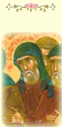
Ὁ Ὁσιος Σωφρόνιος, ὁ Ἐγκλειστος ἐν τῇ Ἱ.Λ. τῶν Σηπλαιῶν τοῦ Κιέβου