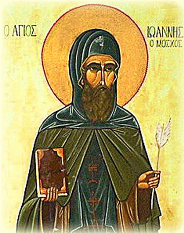
Ὁ Ἅγιος Ἰωάννης Μόσχος, Συγγραφεὺς τοῦ Λειμωναρίου