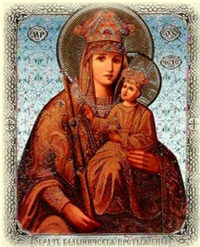
Σύναξις τῆς Ἱερᾶς Εἰκόνος τῆς Ὑπεραγίας Θεοτόκου, τῆς ἐπονομαζομένης «τοῦ Μπελενίκ» (Ρωσία).