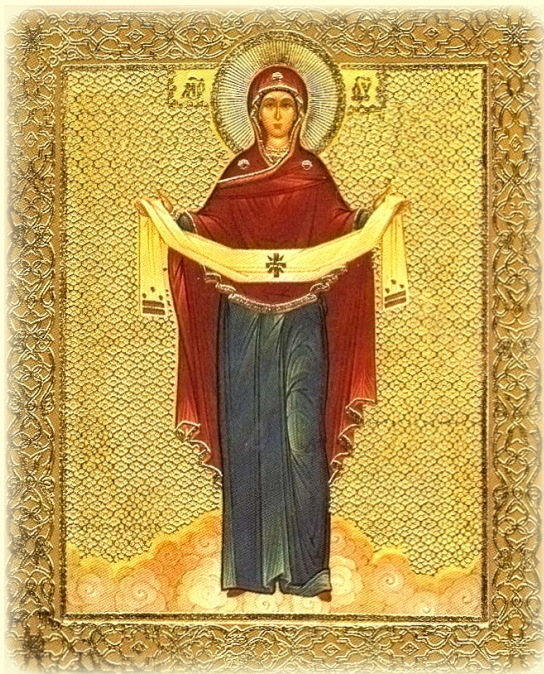
Άνακομιδή τῆς Τιμίας Ζώνης τῆς Ὑπεραγίας Θεοτόκου ἀπὸ τὴν Ἐπισκοπὴ Ζήλας (Καππαδοκία) στὴν Κων/πολι.