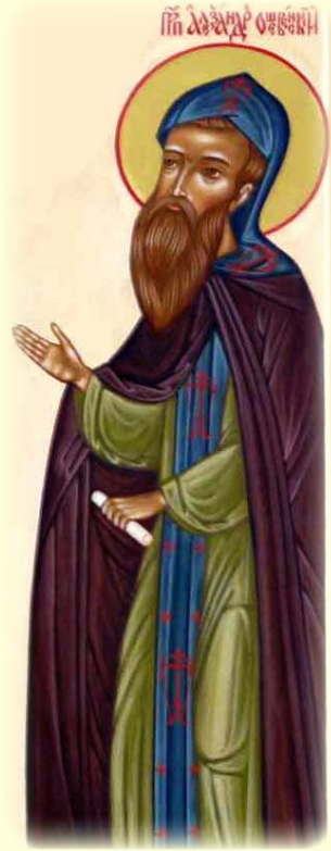
Ὁ Όσιος Ἀλέξανδρος τοῦ Όσεβεν ἐν Όλονετς (Ρωσία).