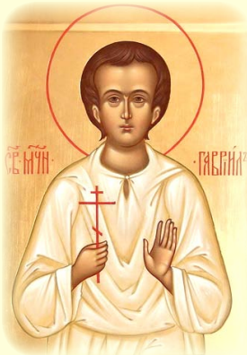
Ὁ Άγιος Μάρτυρ Γαβριὴλ ἐκ Μπιάλυστοκ (Πολωνία).