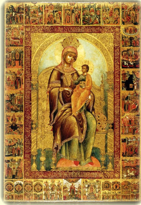
Σύναξις τῆς Ἱερᾶς Εἰκόνος τῆς Ὑπεραγίας Θεοτόκου, τῆς ἐπονομαζομένης «Κυρίας».