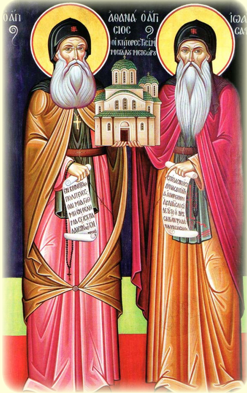
Οί Όσιοι Άθανάσιος, Κτήτωρ τῆς Ἱ. Μ. Μεταμορφώσεως τῶν Μετεώρων, καὶ Ἰωάσαφ, ὁ συνασκητὴς καὶ διάδοχος αὐτοῦ.