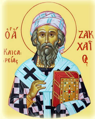
Ὁ Ἅγιος Ἀπόστολος Ζαχαρίας, Ἐπίσκοπος Καισαρείας.