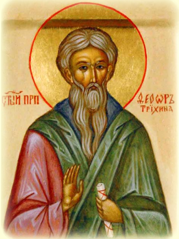
Ὁ Ὅσιος Θεόδωρος ὁ Τριχινᾶς, ὁ ἐν Κων/πόλει.