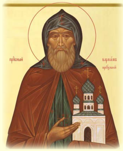
Ὁ Ὅσιος Βαρλαάμ, ὁ ἐν Σερπουχώβ (Ρωσία)