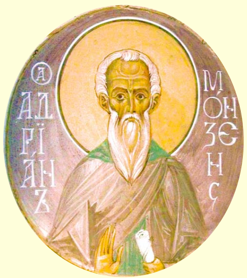
Ὁ Ὅσιος Ἀδριανός, Ἡγούμενος ἐν τῇ Ἱ. Μ. Μόντζα (Ρωσία)