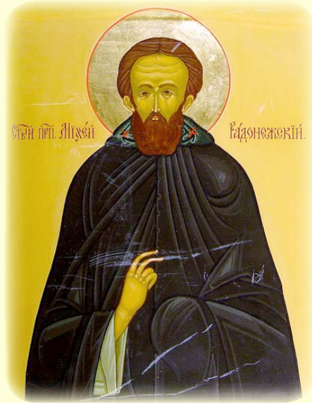
Ὁ Ὅσιος Μιχαίας ἐν Ραδονεζ