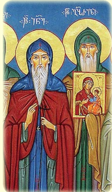
Οί Όσιοι Ίωάννης και Γαβριήλ, οί Ίβηριται