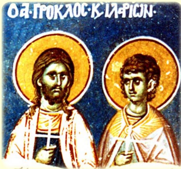
Οί Άγιοι Μάρτυρες Πρόκλος και Ίλάριος, ό άνεπιός αύτοϋ, οί έν Άγκύρα τής Γαλατίας