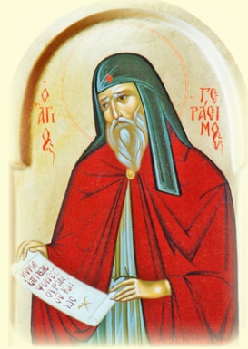
Ὁ Ὅσιος Γεράσιμος (Νοταρᾶς) ἐν Κεφαλληνίᾳ