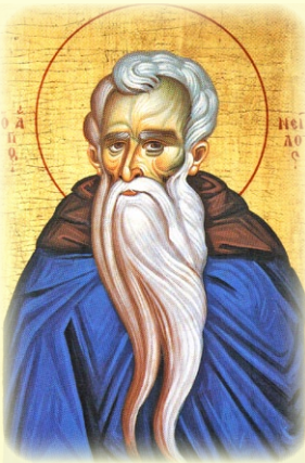
Ὁ Ὅσιος Νείλος, ὁ Ἐρικιώτης (βλ. ἐδῶ)