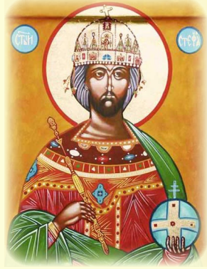
Ὁ Ἅγιος Στέφανος, Βασιλεὺς τῆς Οὐγγαρίας