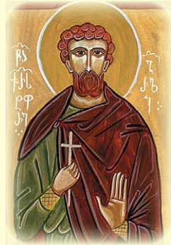
Ὁ Ἅγιος Μάρτυς Χριστο- φόρος, ὁ ἐν Γουρία (Γεωργία)