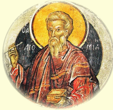
Ὁ Ἅγιος Μάρτυς Διομήδης, ὁ Ἴατρος