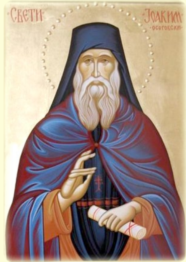
Ὁ Ὅσιος Ἰωακείμ, ὁ ἐν τῷ ὄρει Ὀσσογόκοβ (Βουλγαρία)