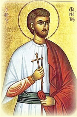
Ὁ Ἅγιος Νεομάρτυς Σταμάτιος ἐκ Βόλου