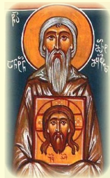
Ὁ Ὅσιος Ἀντώνιος ὁ Στυλί- τῆς ἐν Μαρτκόφῃ (Γεωργία)