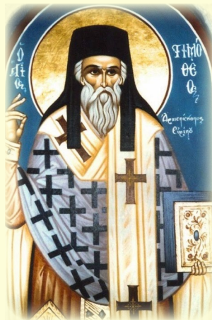
Ὁ Ὅσιος Τιμόθεος, Ἀρχιεπίσκοπος Εὐρίπου καὶ Κτήτωρ τῆς Ἱ. Μ. Κοιμήσεως τῆς Θεοτόκου Πεντέλης