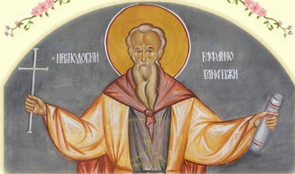
Ὁ Ὅσιος Ραφαήλ, ὁ ἐν Βανάτῳ (Σερβία)