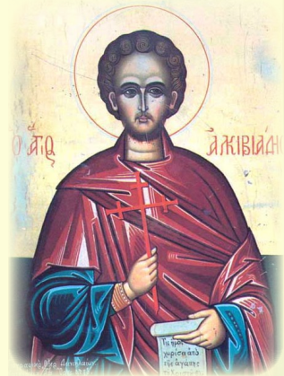
Ὁ Ἅγιος Μάρτυς Ἀλκιβιάδης ἐν Λουγδούνῳ (Γαλλία)