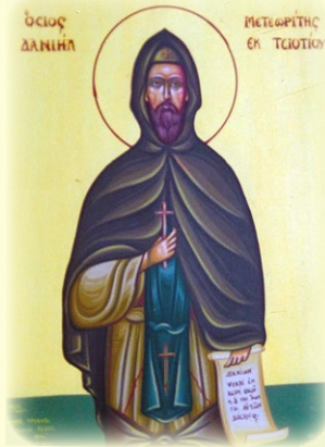
Ὁ Ὅσιος Δανιήλ ὁ Με- τεωρίτης, ἐκ Τσιοτίου