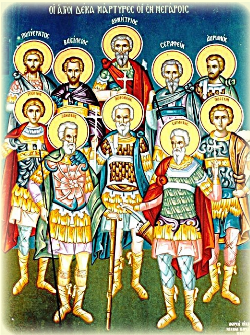
Εὔρεσις τῶν τιμίων Λειψάνων τῶν Ἁγίων Μαρτύρων ἐν Μεγάροις: Πολυεύκτου, Βασιλείου, Δημητρίου, Σεραφεῖμ, Ἀδριανοῦ, Γεωργίου, Ἰακώβου, Δωροθέου, Σαράντη καὶ Πλάτωνος