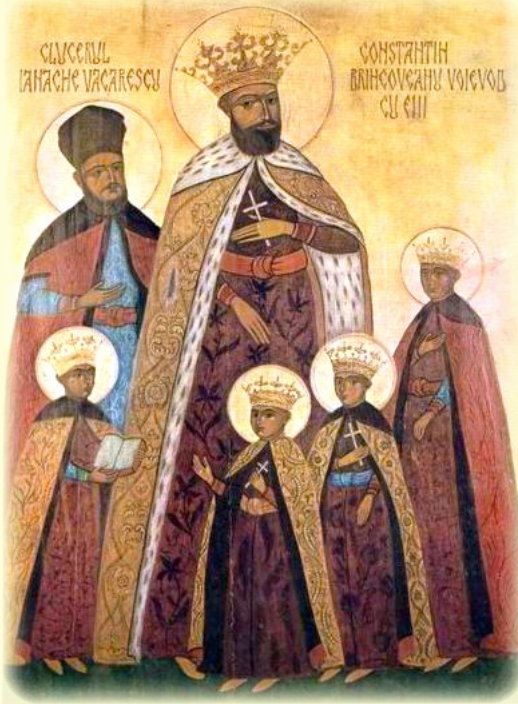
Ὁ Ἅγιος Μάρτυς Κωνσταντῖνος, Ἡγεμὼν Οὐγγροβλαχίας, οἱ Υἱοὶ αὐτοῦ: Κωνσταντῖνος, Στέφανος, Ράδος καὶ Ματθαῖος καὶ ὁ θησαυροφύλαξ αὐτοῦ Ἰωάννης