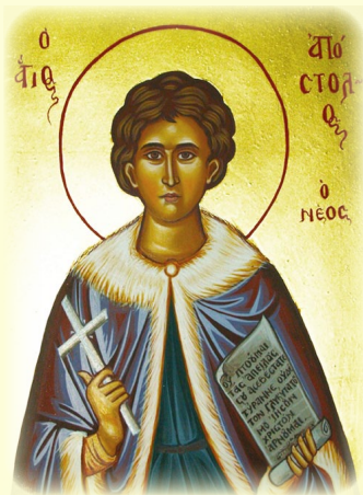
Ὁ Ἅγιος Νέος Μεγαλο- μάρτυς Ἀπόστολος, ὁ ἐκ Πηλίου καὶ ἐν ΚΠόλει μαρτυρήσας