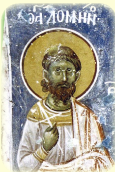
Ὁ Ἅγιος Μάρτυς Δομνίνος