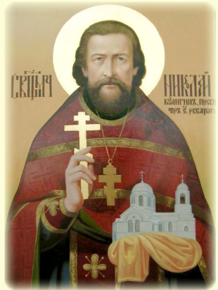
Ό Άγιος Νέος Ίερο- μάρτυς Νικόλαος (Κουλίγκιν), ό έν Ρωσία