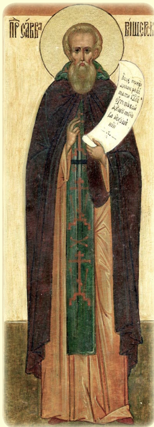
Ὁ Ὅσιος Σάββας, ὁ Στυλίτης καὶ Θαυματουργός, ὁ ἐν Βιτσέρα-Νόβγοροδ ἀσκήσας (Ρωσία)