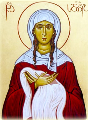
Ή Άγία Σιδωνία έξ Ίβηρίας