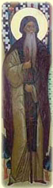
Ὁ Ὅσιος Μπάβων τῆς Γάνδης (βλ. ἐδῶ)