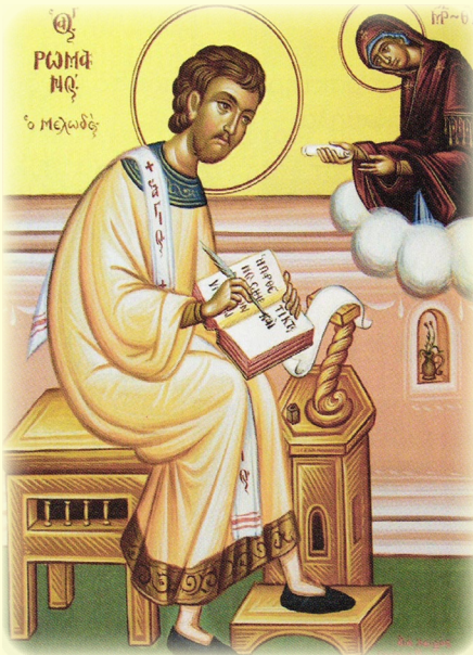
Ὁ Ὅσιος Ρωμανός, ὁ Διάκονος καὶ Μελωδός