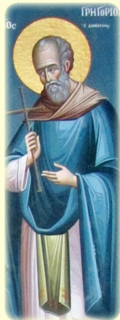
Ὁ Ὅσιος Γρηγόριος ὁ Δομέστικος, ὁ ἐν τῇ Μεγίστῃ Λαύρᾳ