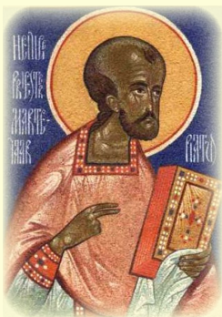
Ὁ Ἅγιος Ἱερομάρτυς Πιάτος ἐν Τουρναί (Βέλγιο)