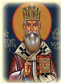
Ὁ Ἅγιος Μελχισεδέκ Α΄, Καθολικός ἐν Ἰβηρία