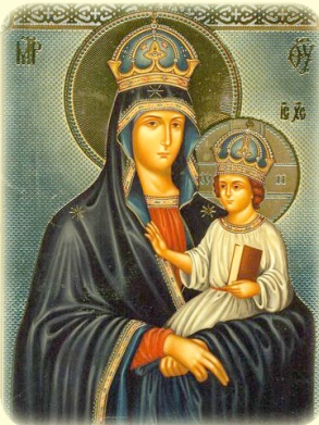
Σύναξις τῆς Ἱερᾶς Εἰκόνος τῆς Ὑπερ- αγίας Θεοτόκου, τῆς ἐπονομαζομένης «Μπάρσκα»