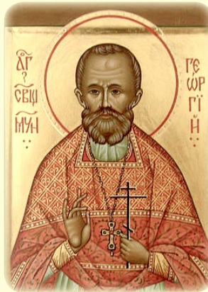
Ό Άγιος Νέος Ίερο- μάρτυς Γεώργιος (Άρχαγγέλσκυ), ό έν Ρωσία