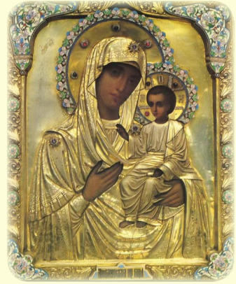
Σύναξις τῆς Ἱερᾶς Εἰκόνος τῆς Ὑπερ- αγίας Θεοτόκου, τῆς ἐπονομαζομένης «Λιούμπλιν» (ἐπάνω) καὶ «Παναγία Γοργο- επήκοος» (ἄριστερα) (βλ. ἐδῶ)