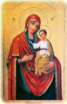
Σύναξις τῆς Ἱερᾶς Εἰκόνος τῆς Ὑπερ- αγίας Θεοτόκου, τῆς ἐπονομαζομένης «Γκερμποβέτσκυ»