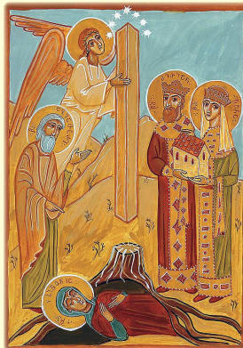
Ἡ φανέρωσις τῆς Μυροβλύτου Στύλης, ὅπου εὑρέθη ὁ Ἱερός Χιτὼν τοῦ Κυρίου ἐν Μτسخέτα (Γεωργία)