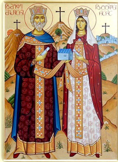
Οί Άγιοι Μιριάν και Νάνα, οί Βασιλείς καί Ίσαπόστολοι έν Ίβηρία