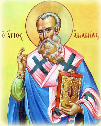
Ὁ Ἅγιος Ἀπόστολος Ἀνανίας, ἐκ τῶν Ὁ', Ἐπίσκοπος Δαμασκοῦ καὶ Ἐλευθερουπόλεως