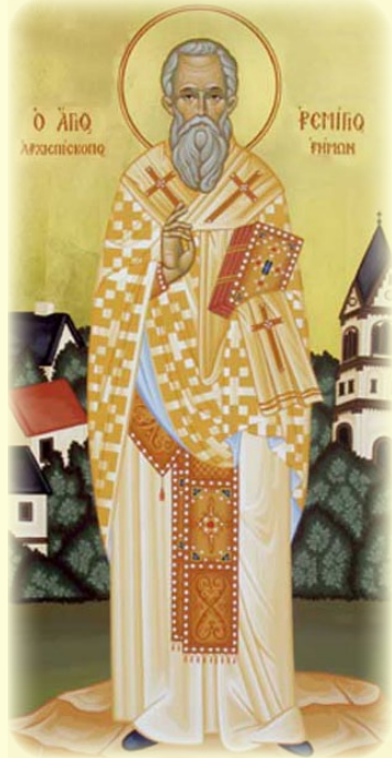
Ὁ Ἅγιος Ρεμίγιος, Ἐπίσκοπος Ῥημῶν καὶ Ἀπόστολος τῶν Φράγκων (Γαλλία, βλ. ἐδῶ )