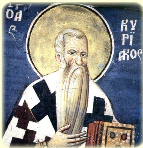
Ὁ Ἅγιος Ἱερομάρτυς Κυριακός, Ἐπίσκοπος Ἱεροσολύμων