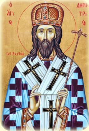
Ὁ Ἅγιος Δημήτριος, Μητροπολίτης Ροστοβίας (βλ. ἐδῶ )