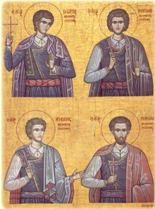
Οἱ Ἅγιοι Μάρτυρες Ἄγγελῆς, Μανουήλ, Γεώργιος καὶ Νικόλαος ἐκ Μελάμπων καὶ ἐν Ρεθύμνῳ μαρτυρήσαντες