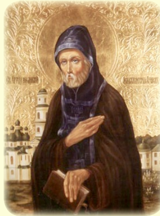
Ὁ Ὅσιος Θεόφιλος, ὁ διὰ Χριστὸν Σαλός, τῆς Ἰ.Λ. τῶν Σηλαιῶν τοῦ Κιέβου