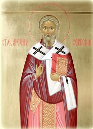
Ὁ Ἅγιος Ἀρσένιος ὁ Α΄, Ἀρχιεπίσκοπος Σερβίας