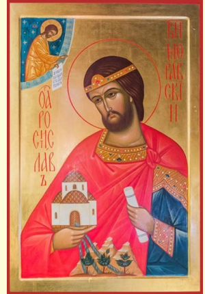
Ὁ Ἅγιος Ἰσαπόστολος Ραστισλάβος, Ἡγεμὼν τῆς Μεγάλης Μοραβίας (βλ. ἐδῶ )