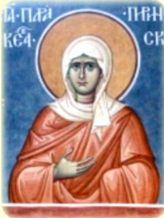
Ἡ Ἁγία Παρασκευὴ τοῦ Πιρμίν (βλ. ἐδῶ )