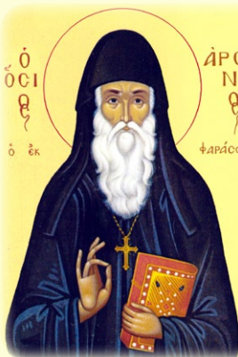
Ὁ Ὅσιος Ἀρσένιος ἐκ Φαράσων

Οἱ Ἅγιοι Μάρτυρες Τερέντιος καὶ Νεονίλλα, οἱ ὁμόζυγοι, καὶ τὰ τέκνα αὐτῶν: Σαρβήλος, Φώτιος, Θεόδουλος, Ἰέραξ, Νίτας, Βήλη καὶ Εὐνίκη