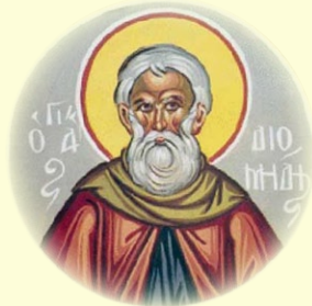
Ὁ Ὅσιος Διομήδης ἐκ Κύπρου