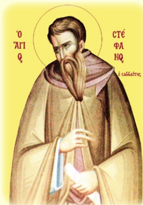
Ὁ ἅγιος Στέφανος ὁ Σαββαΐτης