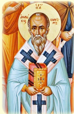
Ὁ ἅγιος Ἀθανάσιος, Πατριάρχης ΚΠόλεως