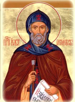
Ὁ Ὅσιος Ἰῶβ τοῦ Ποτσαέφ