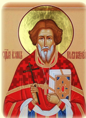
Ό Άγιος Νέος Ίερομάρ- τυς Ίωάννης (Δνέ- προφσκυ), ό έν Ρωσία