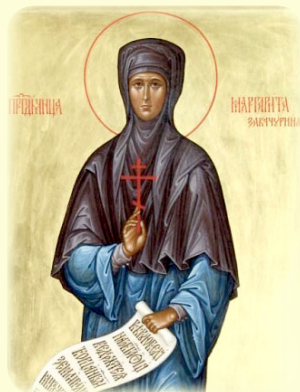
Ή Άγία Νέα Όσιο- μάρτυς Μαργαρίτα (Ζακατούρινα), ή έν Ρωσία