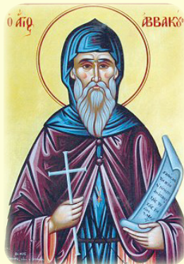
Ὁ Ὅσιος Ἀββακοϝμ ἐκ τῶν Ἀλαμανᵱᵱ