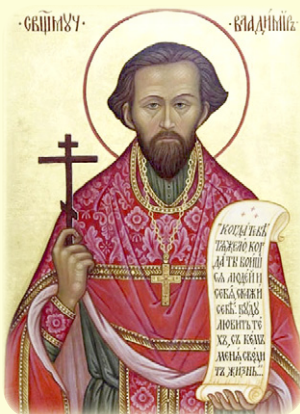
Ό Άγιος Νέος Ίερομάρ- τυς Βλαδίμηρος (Προ- φεράσνωβ), ό έν Ρωσία