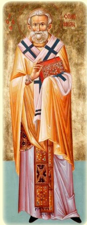
Ὁ Ἅγιος Σολομᵱᵱ, Ἀρχιεπίσκοπος Ἐφε῱σου