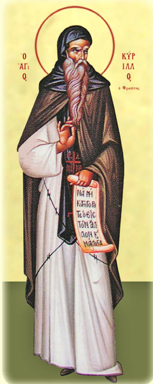
Ὁ Ὅσιος Κύριλλος, ὁ Φιλεώτης (βλ. ἐδᵱ)