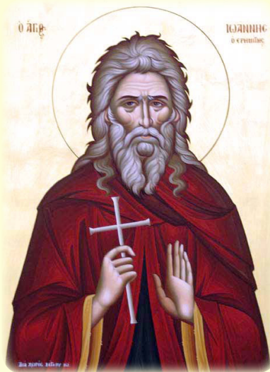
Ὁ Ὅσιος Ἰωάννης ὁ Ἐρημίτης