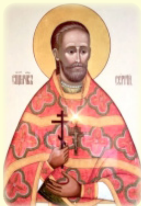
Ό Άγιος Νέος Ίερο- μάρτυς Σέργιος (Φελί- τσον), ό έν Ρωσία