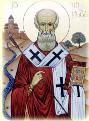
Ὁ Ἅγιος Ἴεσσαί, Ἐπίσκοπος Τσίλκανσκ (Ἰβηρία)