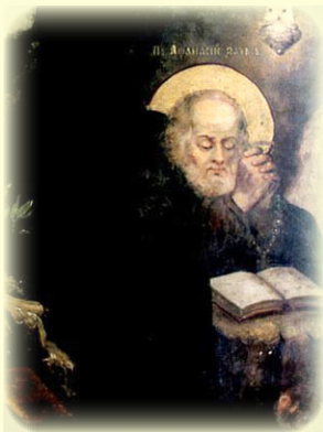
Ό Όσιος Άθανάσιος, ό Έγκλειστος της Ί.Λ. των Σηλαιών του Κιέβου