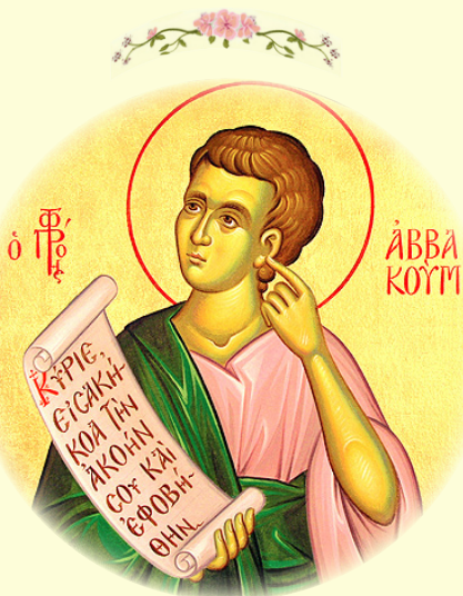
Ὁ Ἅγιος Προφήτης Ἀββακούμ