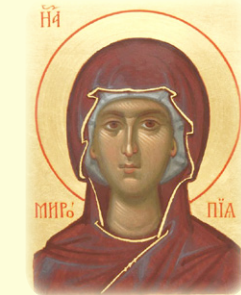
Ἡ Ἁγία Μάρτυς Μυρόπη (βλ. ἐδᵱ)