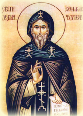
Ό Όσιος Ίωαννίκιος, ό έν Δέβιτις (Σερβία)