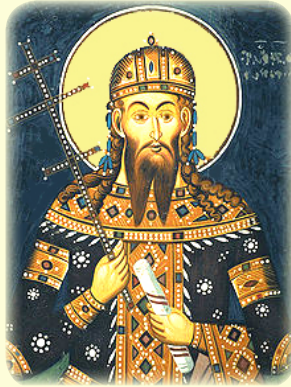
Ὁ Ἅγιος Στέφανος Ἐϝϝρεσης, Βασιλεϝς τῆς Σερβίας