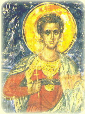
Ὁ Ἅγιος Μάρτυς Ἄβιβος