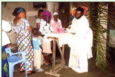
Εὐλόγησι τῶν ὠν στήν Πασχαλινὴ Θεία Λειτουργία στήν Κινσάσα.

Παραθέτουμε ἐδῶ κάποια ἐνδεικτικά Ἱεραποστολικά στιγμιότυπα: