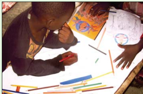
Ἀπὸ τὰ Μαθήματα Σχεδίου - Ἀγιογραφίας στὰ μικρὰ ἀφρικανόπουλα.