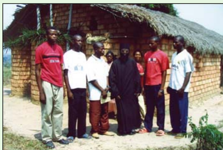
Στὴν Ἑνορία τοῦ Ἁγίου Νικολάου Μύρων στήν Νγκάντζα τῆς Κανάγκα.