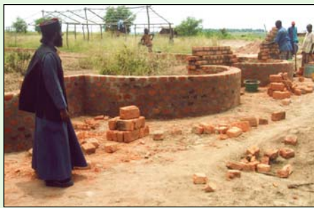
Στὸν ἀνεγειρόμενο Ἱερὸ Ναὸ Κοιμήσεως τῆς Θεοτόκου στὸν χῶρο τοῦ μελλοντικοῦ Ἱουχαστηρίου στήν περιοχή τῆς Κανάγκα.