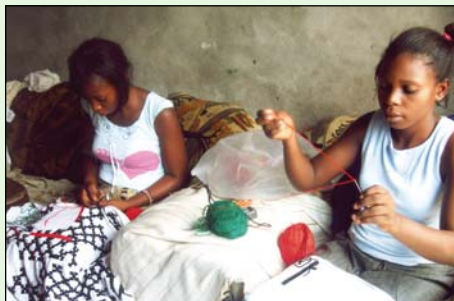
Ἀπὸ τὰ Μαθήματα Ραπτικῆς - Κεντητικῆς σὲ νέες κοπέλλες τῆς Ἱεραποστολῆς.