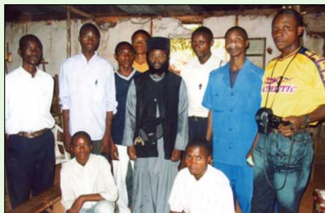
Μέ τοὺς Ἱεροψάλτες στὸν Ἱερὸ Ναὸ Ἁγίου Βασιλείου τοῦ Μεγάλου στό Μπουτζίμαγι.