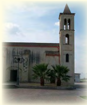
Chiesa Santa Greca