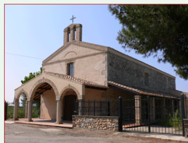
Chiesa Santa Vitalia

La Santa, non disconoscendo la sua fede in Cristo, fu incarcerata e incatenata nelle segrete della prigione e sottoposta ad orribile martirio: tra minacce, percosse, sfregi, insulti e provocazioni. Ma la sua preghiera incommensurabile innalzata a Cristo elargì in Lei la forza nel sopportare coraggiosamente le torture inflitte dai suoi spietati aguzzini.