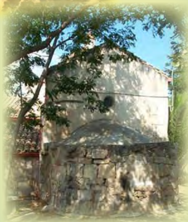
ESTERNO DELLA CRIPTA O PRIGIONE DI SANTA GRECA