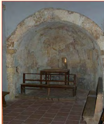
Cripta Santa Greca

Le sue Sacre Spoglie, il Santuario, e la Cripta, (o prigione, per le leggende narrate), elargiscono sulla terra di Sardegna, onore e gloria alla vita di questa fanciulla; una Santa che nel suo martirio consacrò la purezza per l’amore del suo Dio; e come fiaccola splendente fa sgorgare, dalle sue reliquie, innumerevoli miracoli a coloro che a Lei accorrono con fede e devozione.